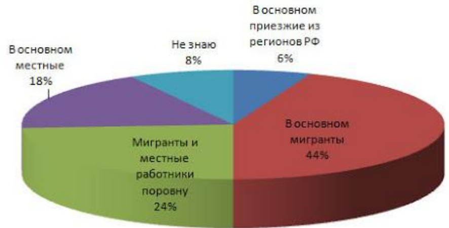
Кто вместе с Вами работает на Вашем предприятии или в Вашей организации?