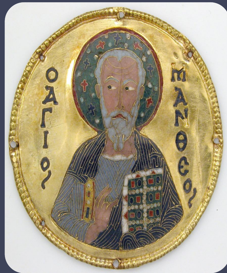
Медальон со Святым Матфеем из рамы иконы

Техника изготовления эмали была заимствована из Византии вместе с принятием христианства. Эмали на Руси ценились наравне с золотом и серебром и сравнивались по своим качествам с драгоценными камнями и самоцветами. Существовали различные способы нанесения эмали на металлическое изделия, но наибольшее распространение на Севере получило изготовление перегородчатых и живописных эмалей.