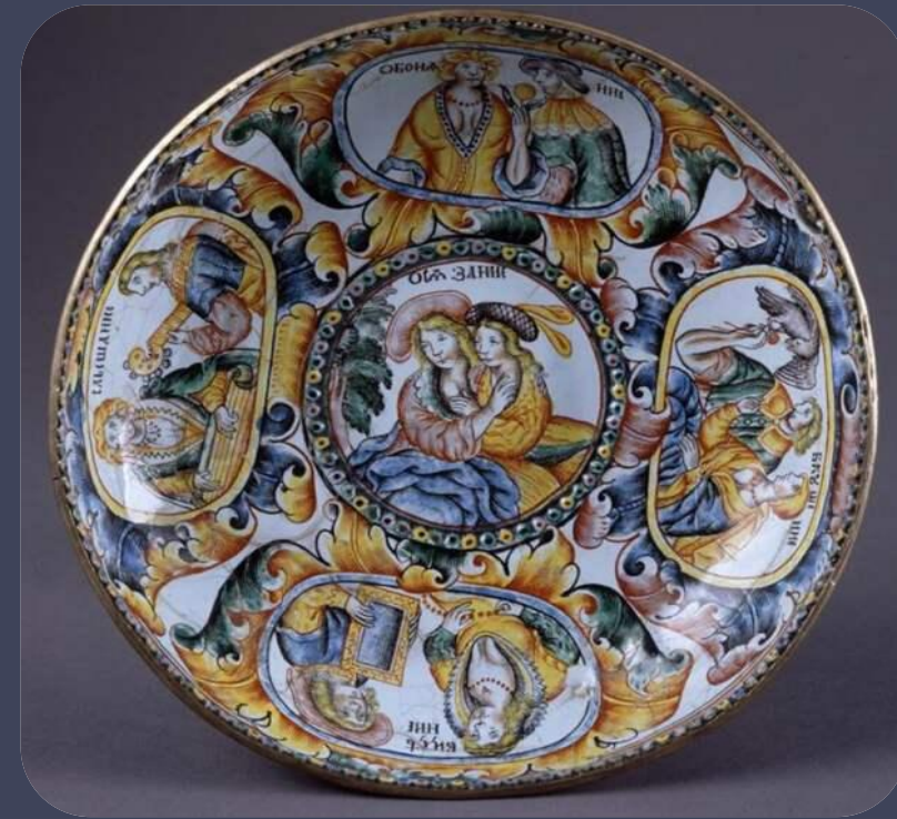
Чаша, Сольвычегодск, конец XVII в.

Усольская эмаль в свою очередь оказала сильное влияние на развитие эмальерного искусства других центров, в частности московского. Неслучайно многих мастеров неоднократно вызывали в Москву для поднятия «финифтяного дела».