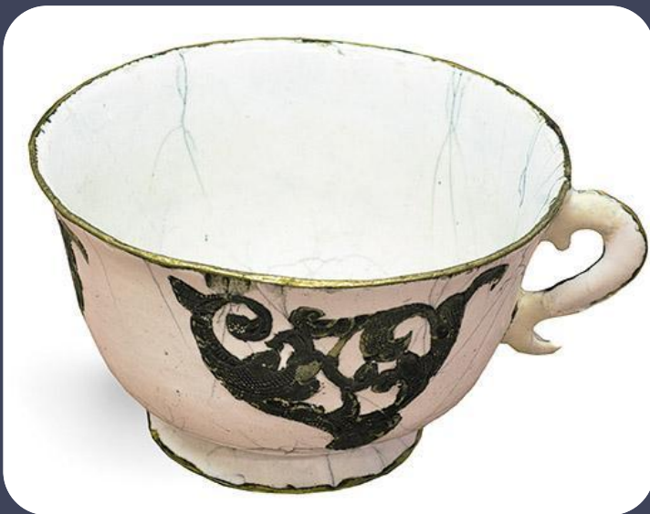
г. Великий Устюг. Фабрика Афанасия и Степана Поповых. XVIII в.

Крупный центр изготовления изделий с перегородчатыми эмалями сформировался в Великом Устюге. Излюбленной цветовой гаммой у мастеров севера были белые, светло-желтые, голубые, глубокие синие почти черные и зеленые. Ведущее положение в стране долгое время занимали сольвычегодские мастера. Живописные эмали Сольвычегодска, входившего в состав Вологодской губернии, в древних описях и документах получили название эмалей «усольского дела», так как город Сольвычегодск еще в начале XVI века назывался Усольском. Вместо дорогостоящих металлов серебра и золота мастера использовали медь, что значительно удешевило изделия и позволило расширить ассортимент. Такие предметы охотно раскупались людьми разных сословий, также они нашли широкое применение в быту царского и патриаршего двора.