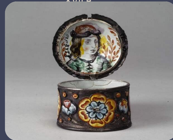
Коробочка. Сольвычегодск, 1690-е гг. Мастера Братья Поповы