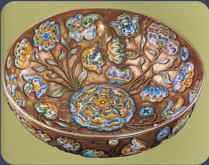
Сольвычегодск, кон. XVII века.