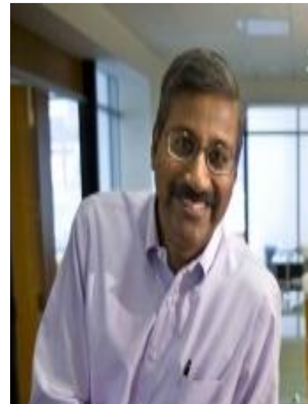
К. Рам Шрирам