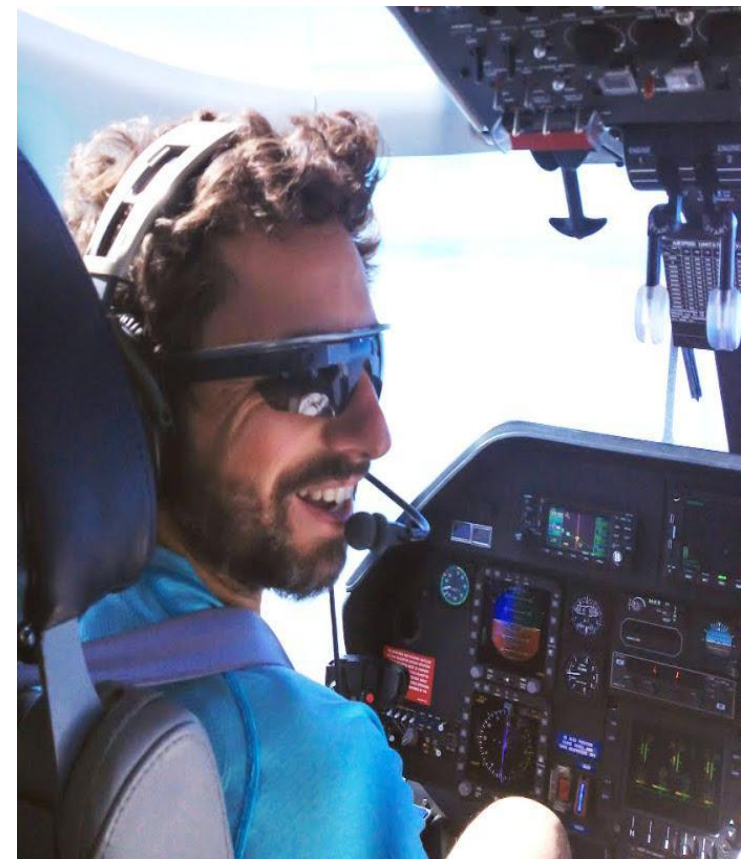
Соучредитель Сергей Брин