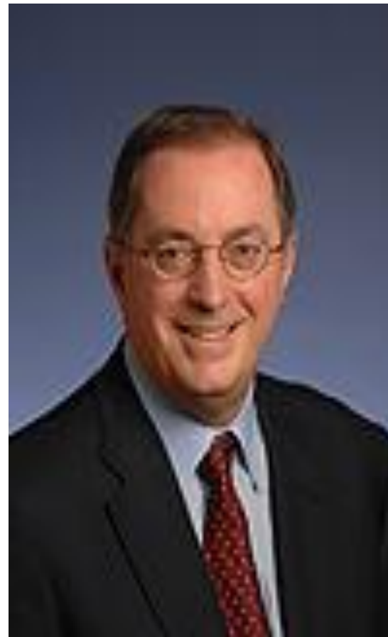
Джон Л. Хеннеси