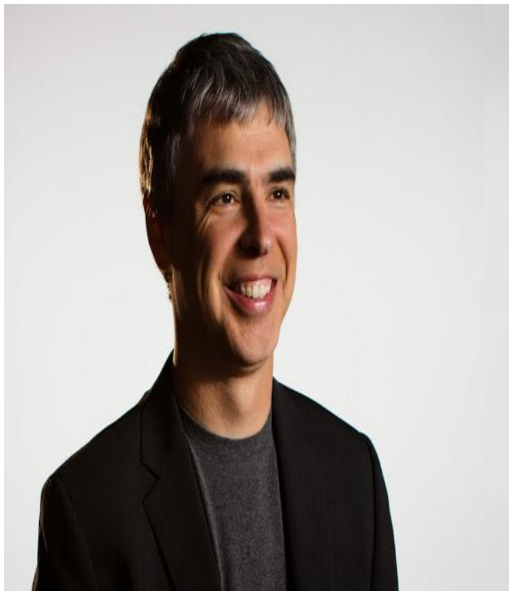
Генеральный директор и соучредитель Ларри Пейдж