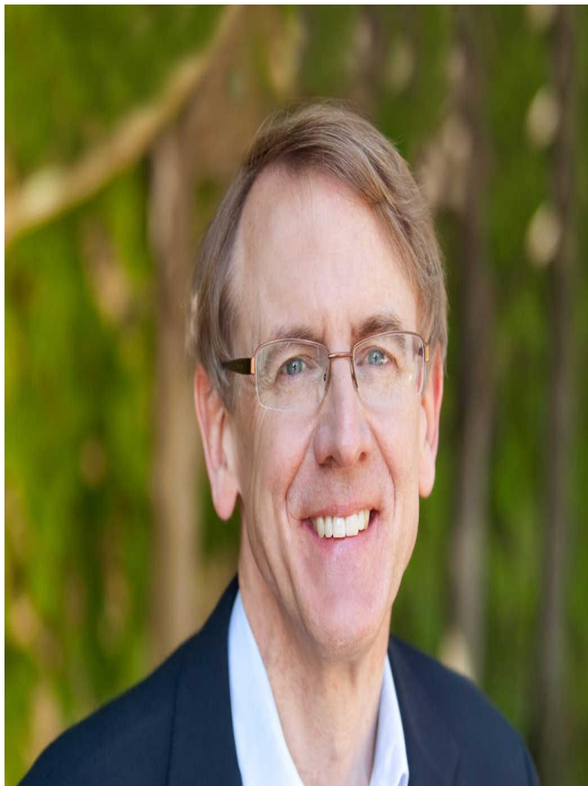
Л. Джон Дёрр