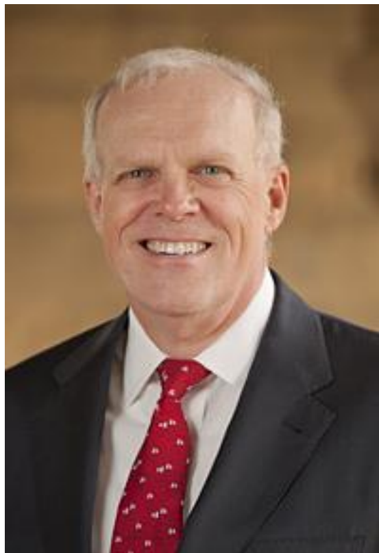
Джон Л. Хеннеси