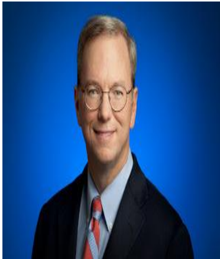
Председатель совета директоров Эрик Э. Шмидт