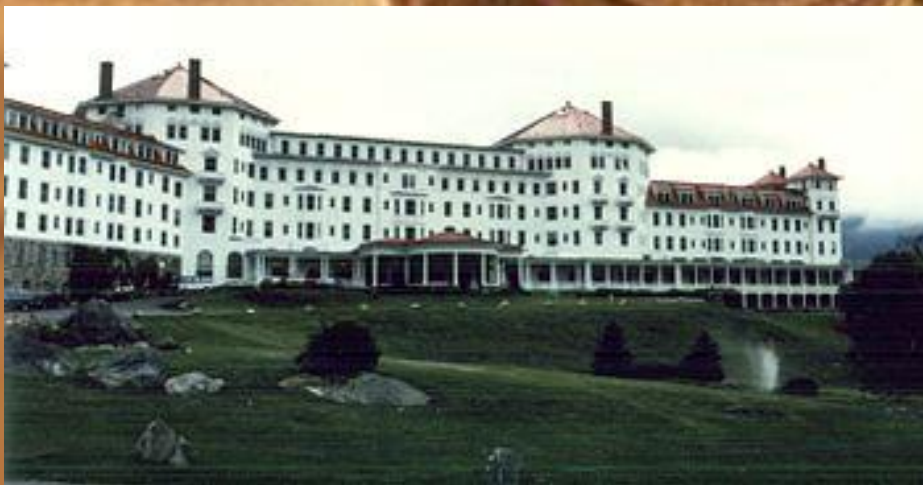
Отель Маунт Вашингтон, где проходила Бреттон- Вудская конференция