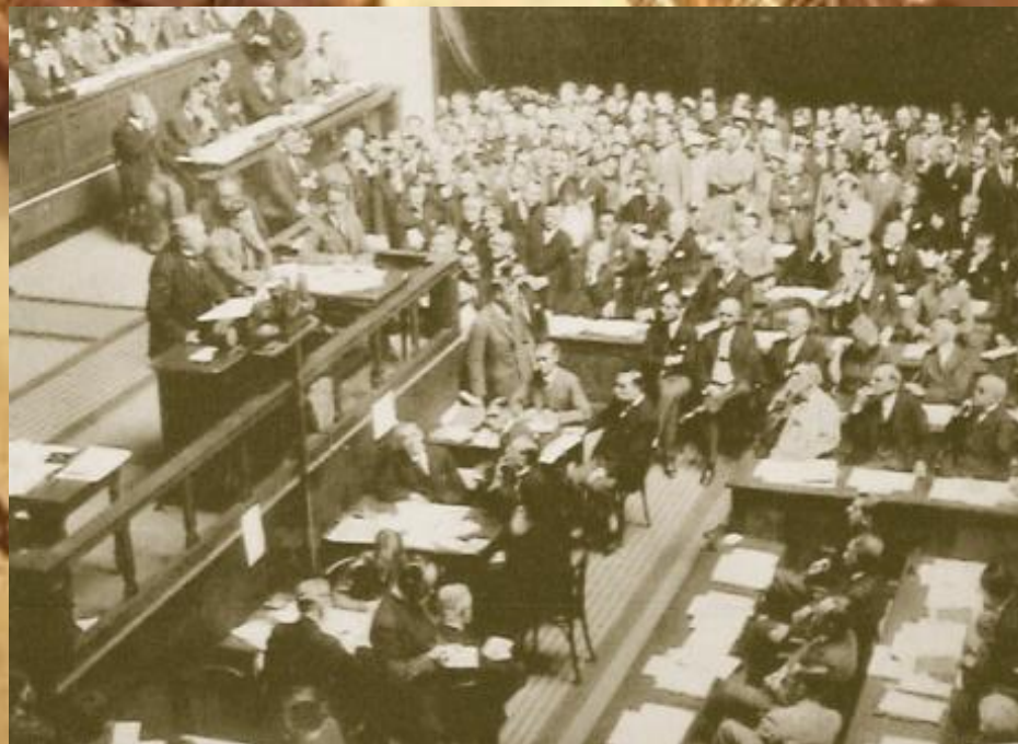
Совещание 22 июля 1944 г. (Валютно-финансовая конференция Организации Объединённых Наций (The United Nations Monetary and Financial Conference)