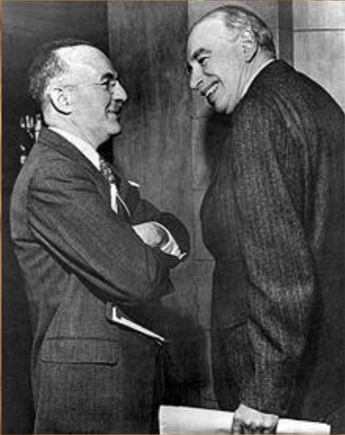
Гарри Декстер Уайт, представлявший на конференции США (слева), и Джон Мейнард Кейнс, представлявший Великобританию (справа), на Бреттон-Вудской конференции