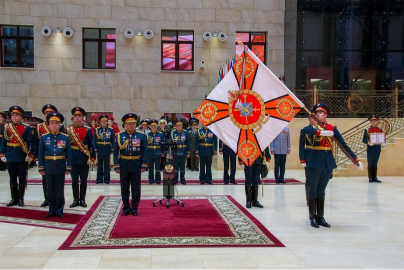
Вручению боевого знамени