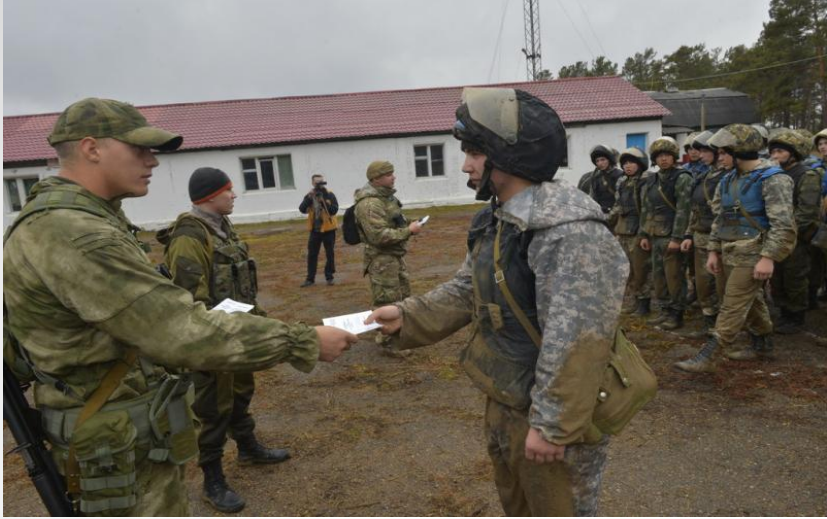
Посвящение в боевую специальность