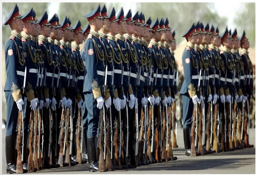
Встреча почетных гостей