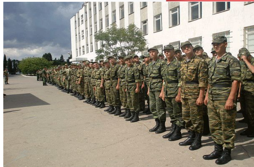
Общая вечерняя поверка воинской части