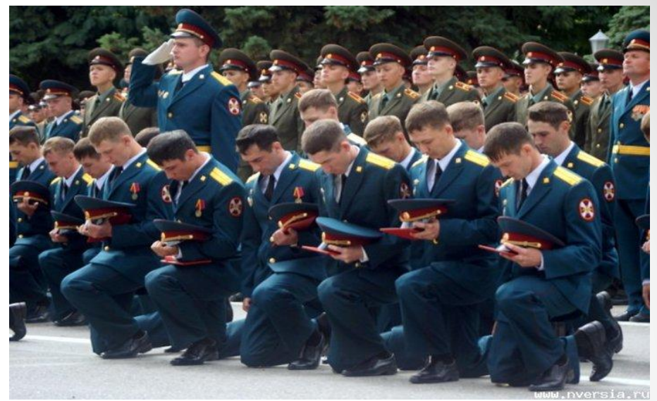
Выпуск молодых офицеров