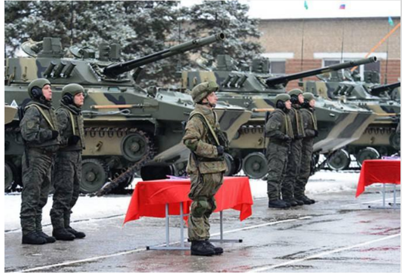
Вручению личному составу вооружения, военной техники и стрелкового оружия