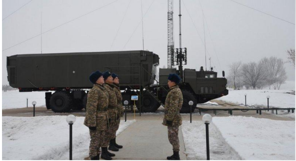
Заступление на боевое дежурство