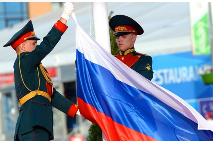
Подъем государственного флага