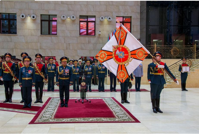
Вручению боевого знамени