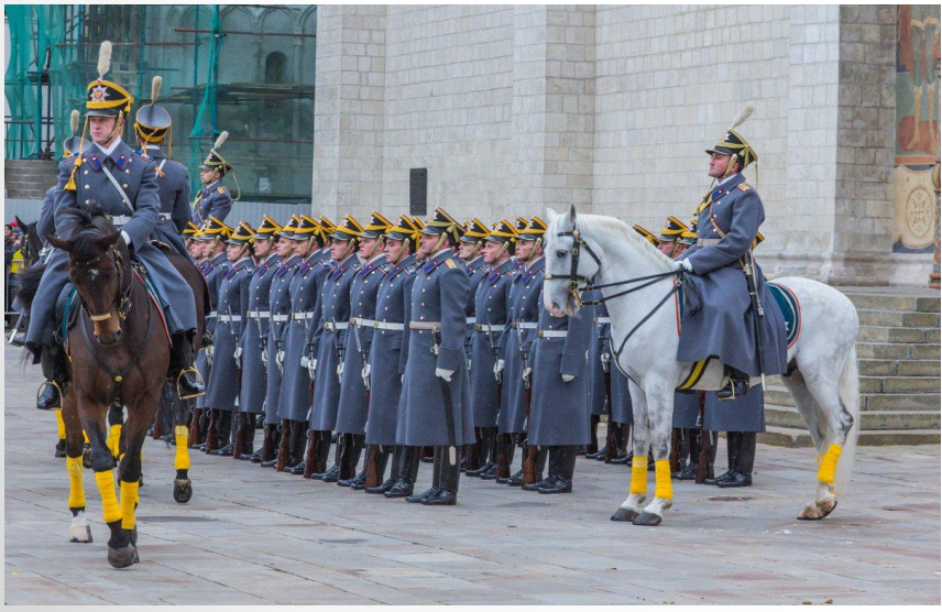
Развод и смена караулов