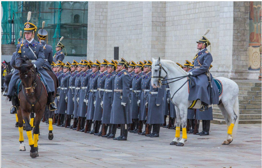
Развод и смена караулов