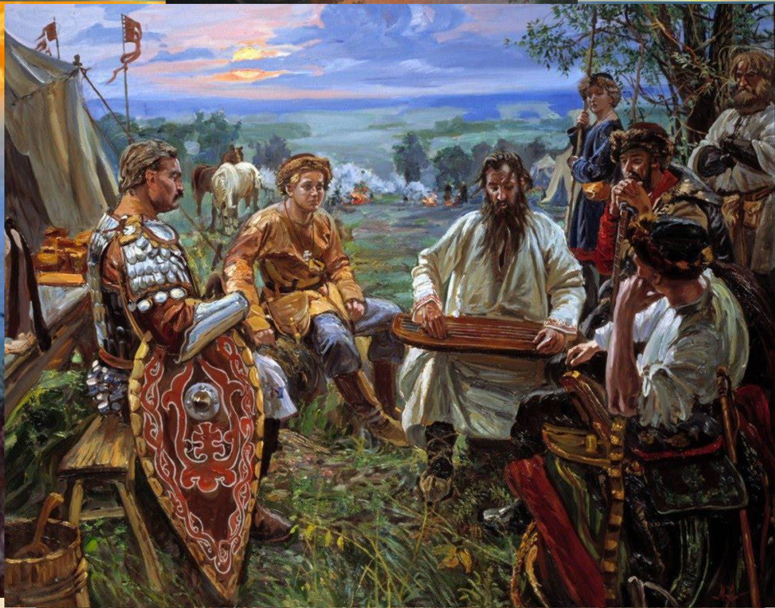
Художник: Ольшанский Б.