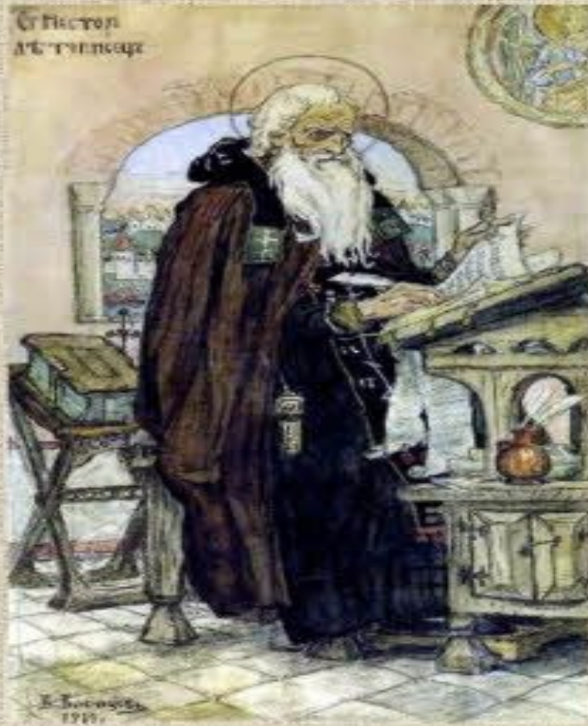
Нестор - первый русский летописец.

«Повесть временных лет» — первая русская летопись начала XII века.