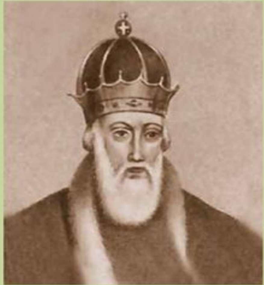
Князь киевский Владимир Святославович