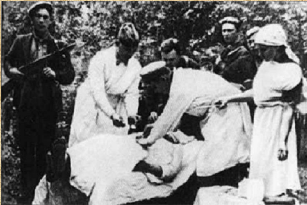
В таких условиях приходилось оперировать раненых партизан. Рядом идет бой с карателями.