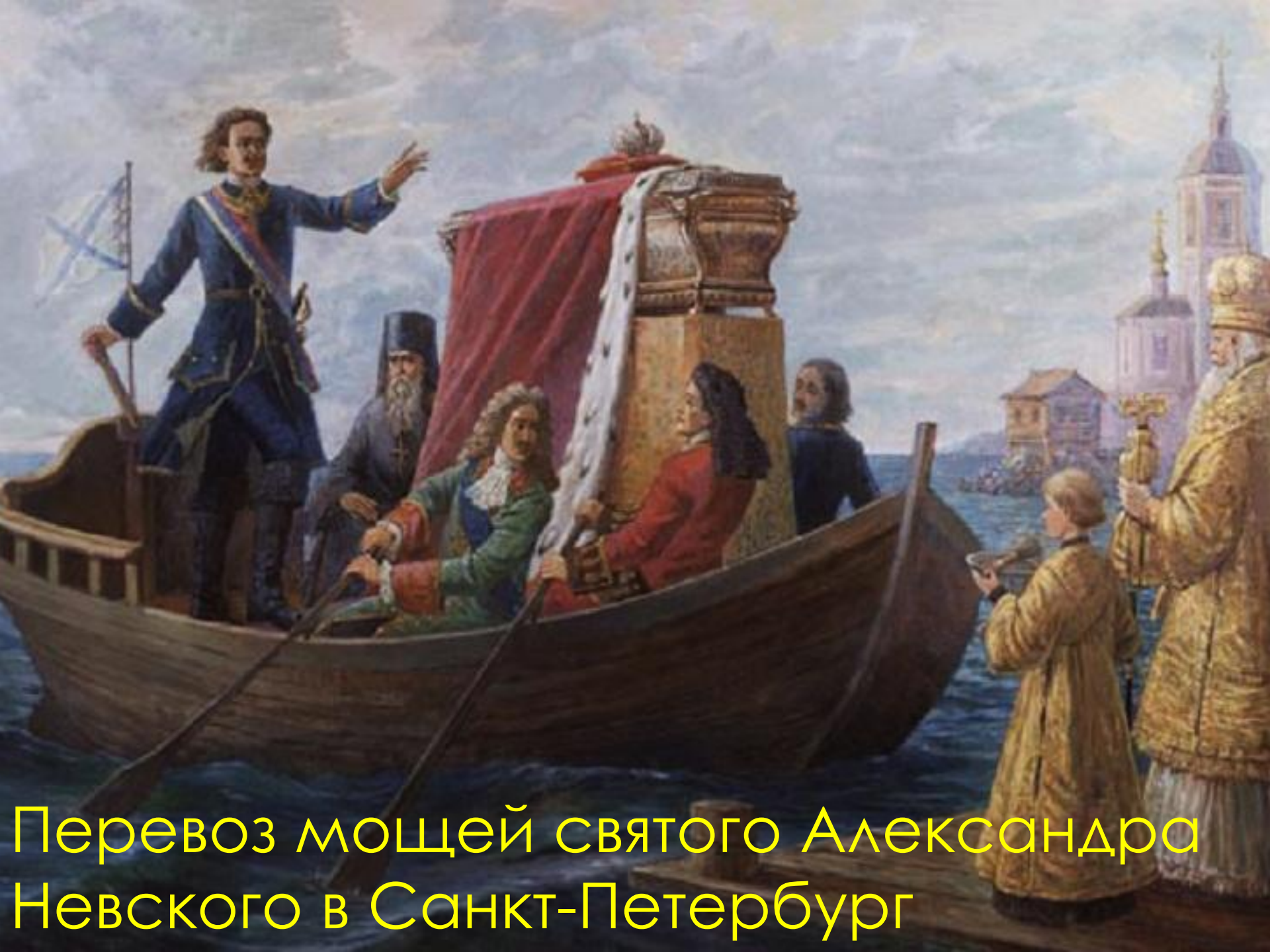
Перевоз мощей святого Александра Невского в Санкт-Петербург