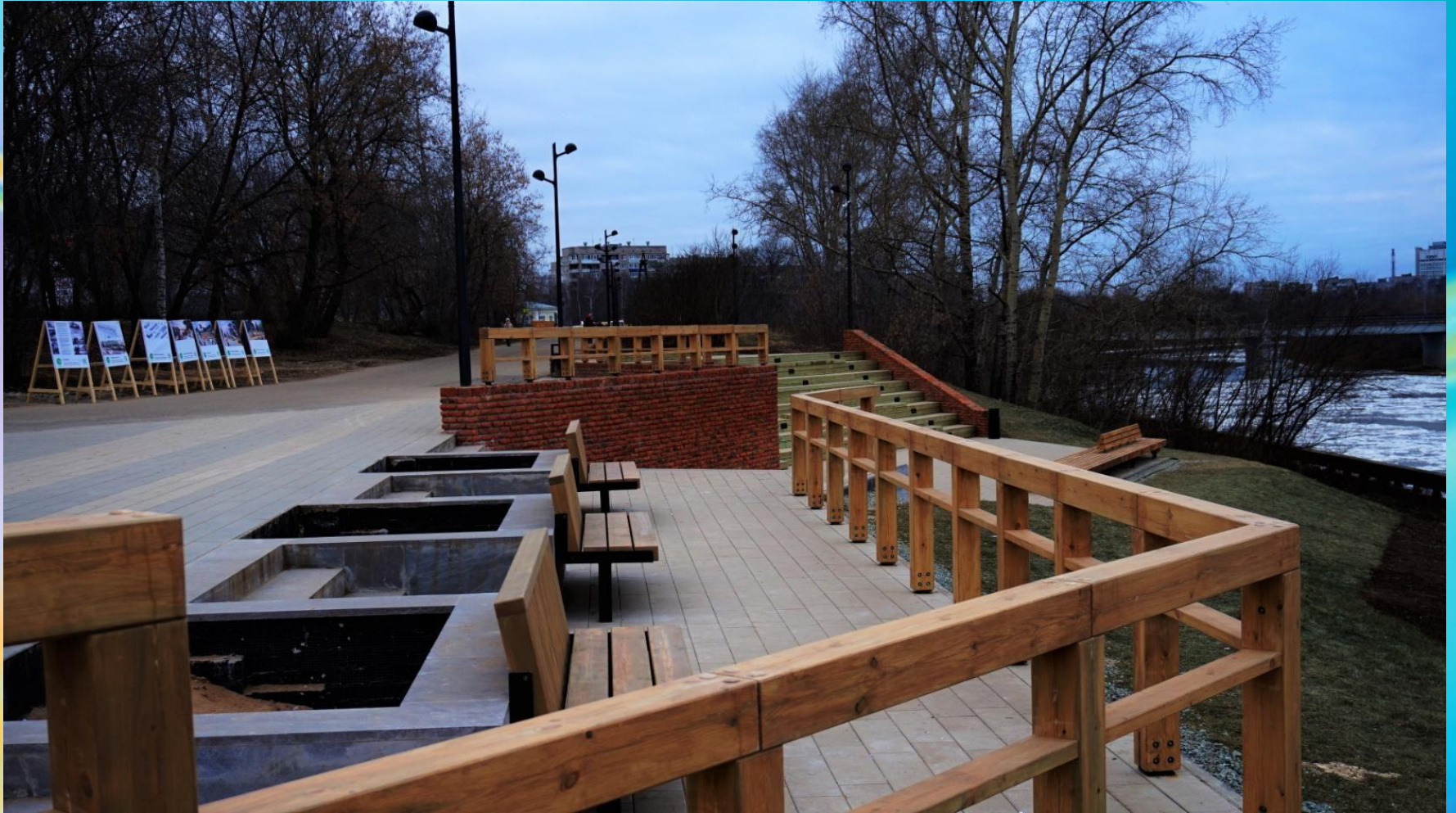
Набережная реки (фото Т. Ивановой, г. Глазов)