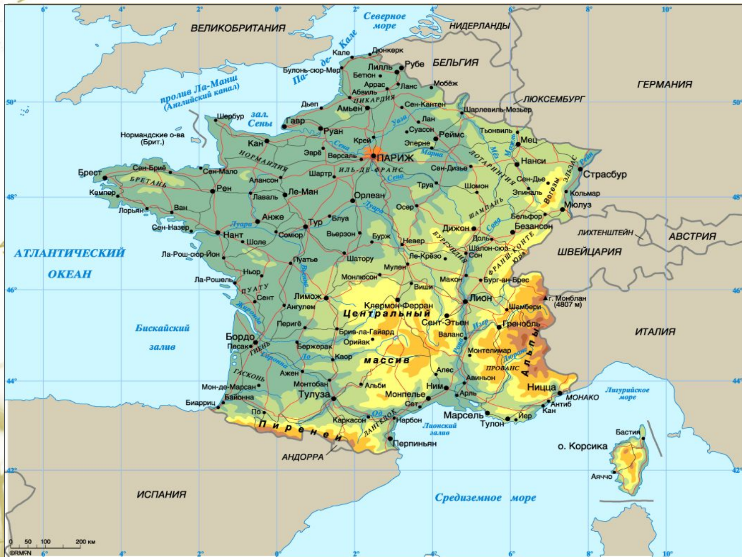
Франция на карте.