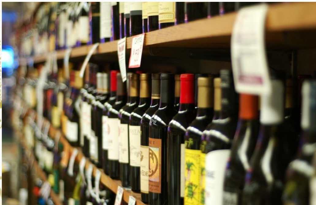
Вина (бордо, божоле нуво, шампанское).