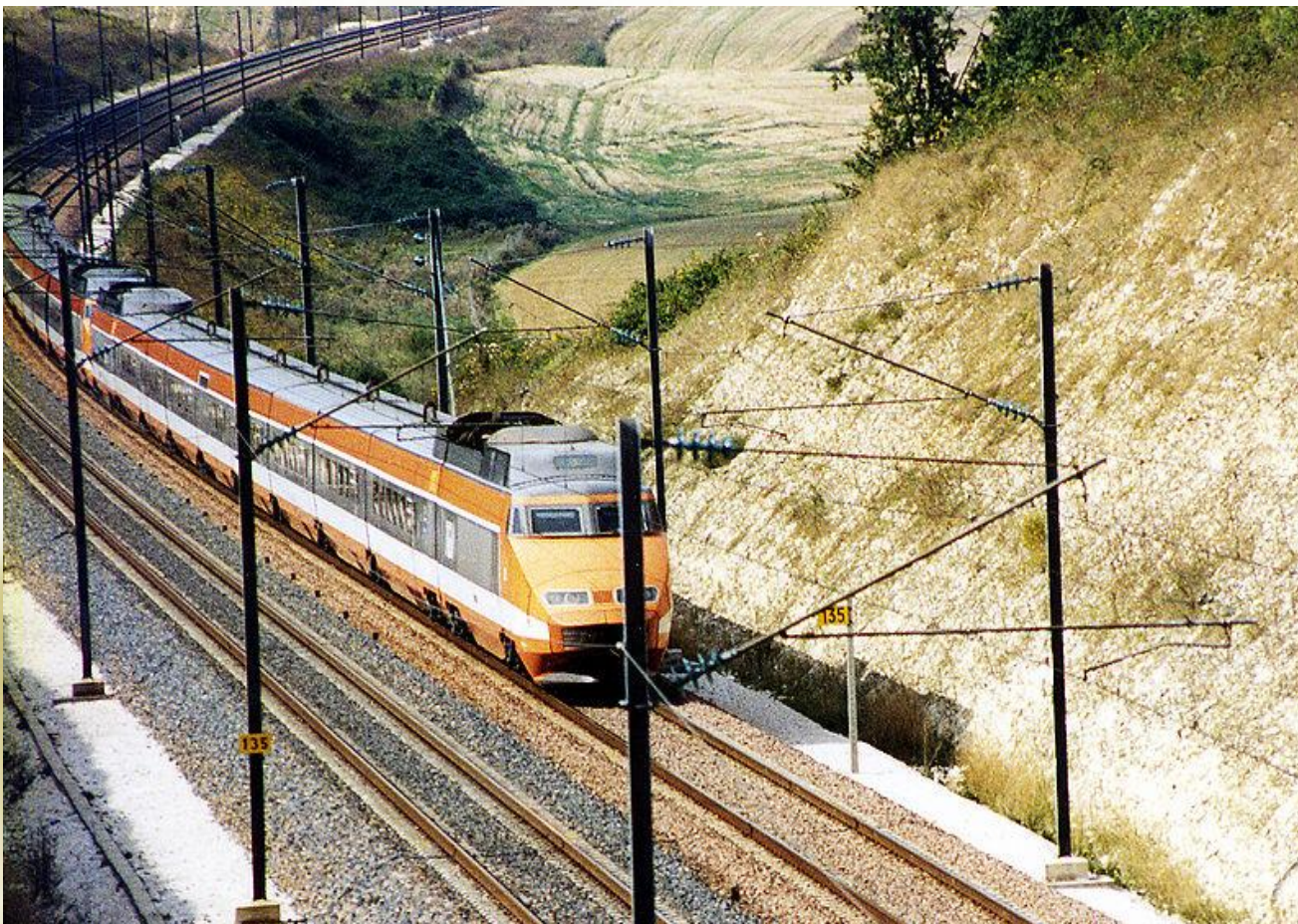
Поезд TGV PSE на линии Париж—Лион.