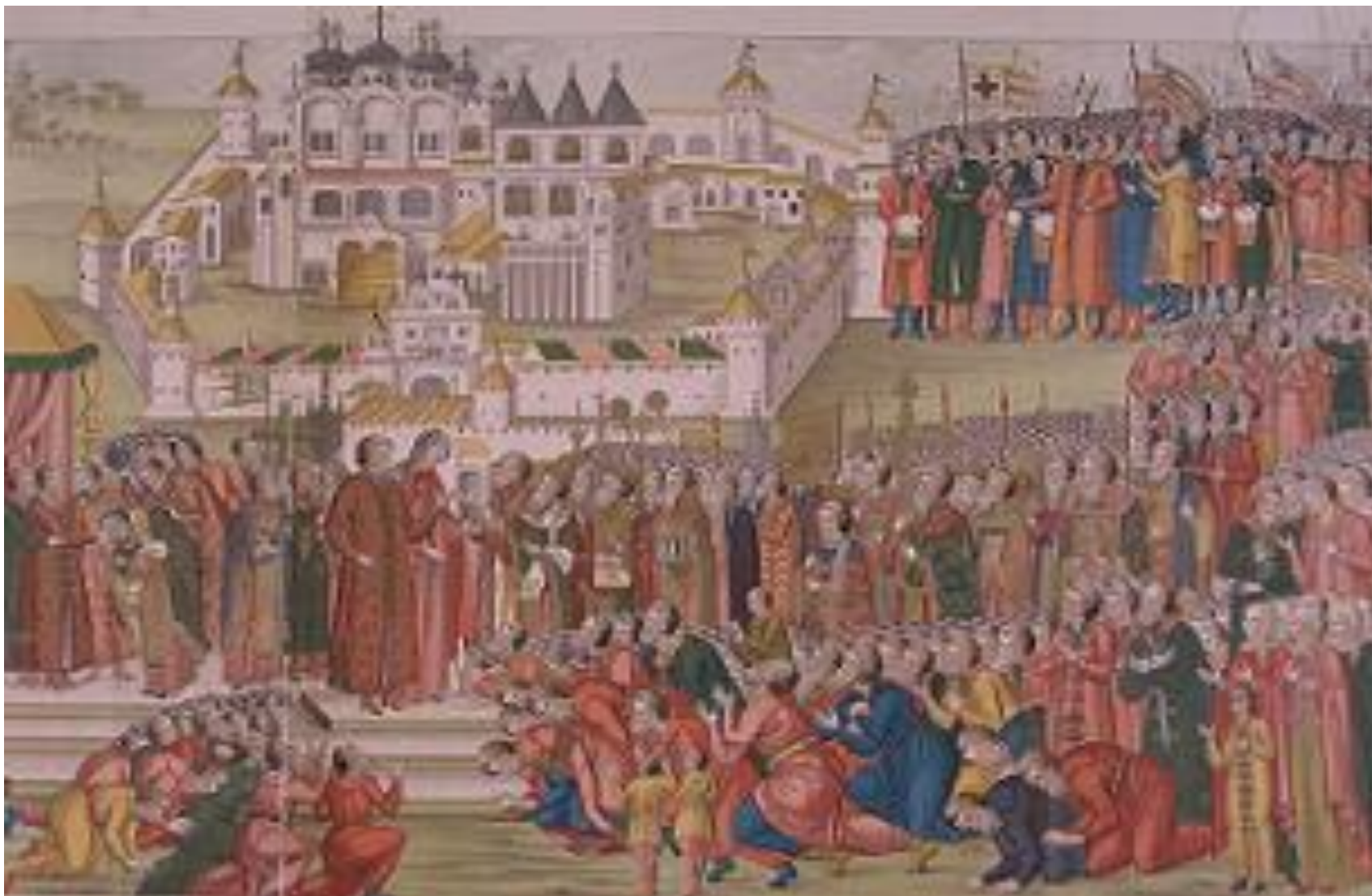
Михаил Романов в Ипатьевском монастыре. Михаил, представитель одного из знатнейших родов скрывался от других претендентов на престол под Костромой и в Ипатьевском монастыре. Иван Сусанин спас будущего царя, не выдав его полякам