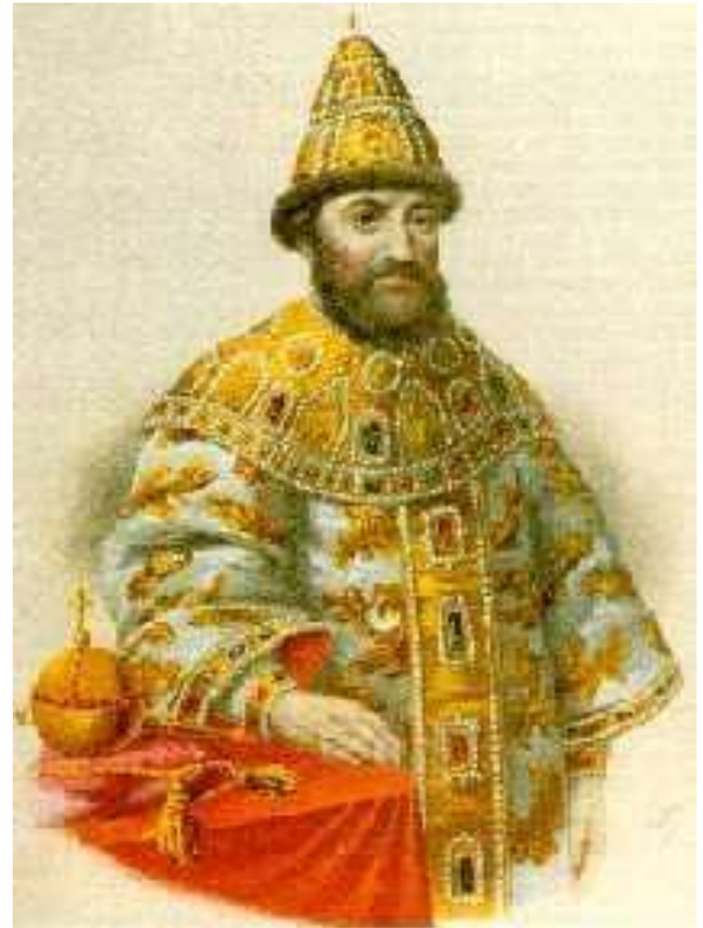
Михаил Федорович, основатель династии Романовых. (1613 - 1645)