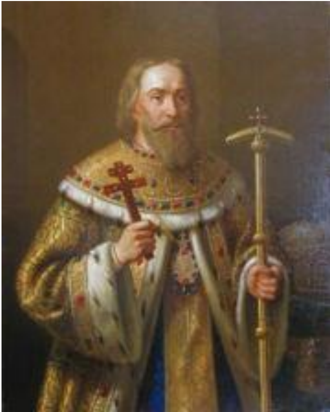
Филарет (Романов), отец царя, патриарх с 1619 г.