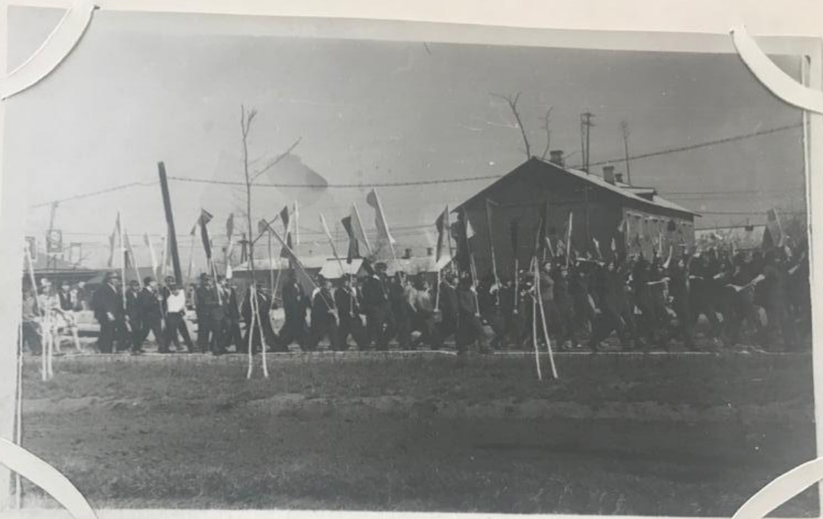
Первомайское шествие трудящихся 1969.