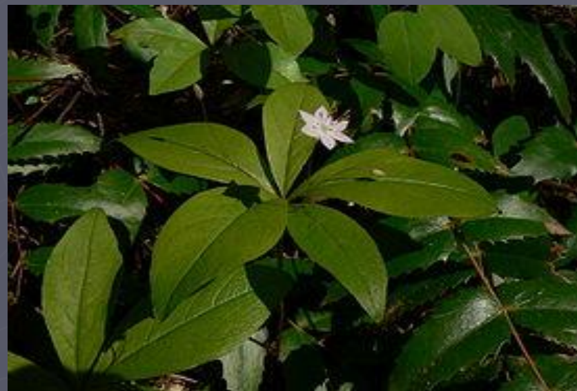
Седмичник (сырые леса)