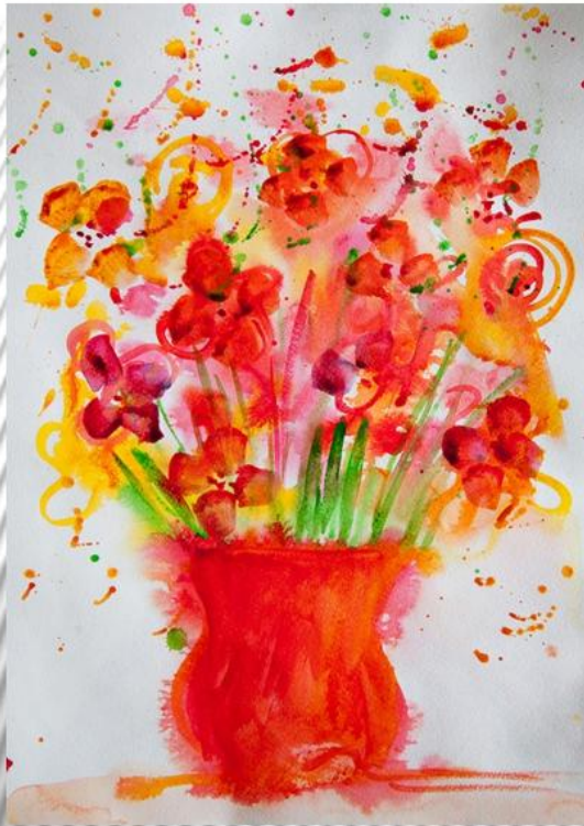
Теплые цвета цвета