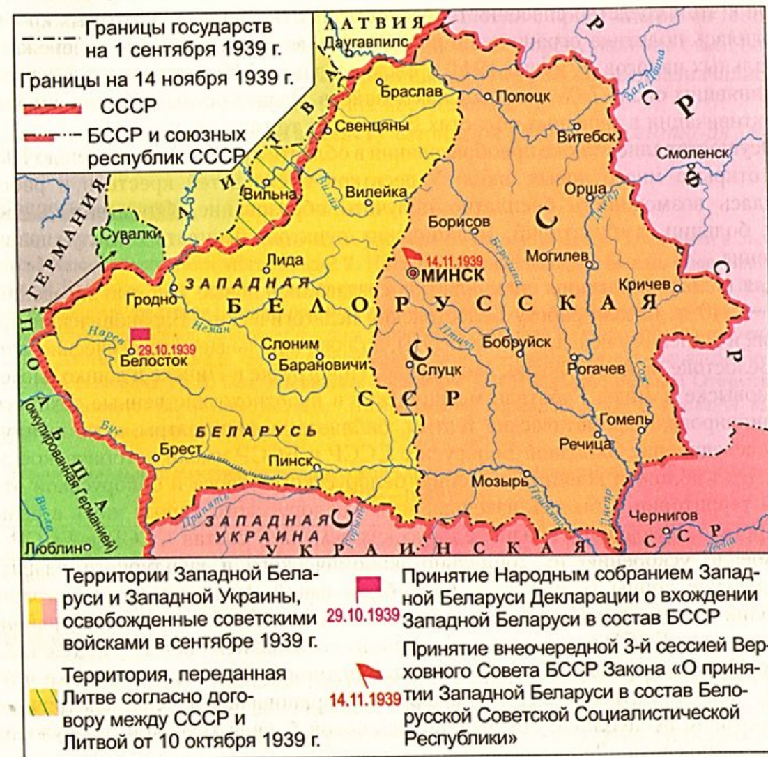
Воссоединение Западной Беларуси с БССР (17 сентября — 14 ноября 1939 г.)

В результате этого исторического события территория БССР увеличилась с 125,5 тыс. км 2 до 225,7 тыс. км 2 , численность населения выросла почти в 2 раза и составила 10 млн. 200 тыс. человек.