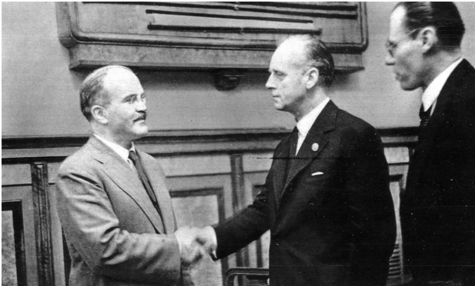
Молотов и Риббентроп после подписания советско-германского договора о дружбе и границе между СССР и Германией. Москва 28 сентября

В условиях нависшей угрозы с Востока, а также нежелания Великобритании и Франции создавать вместе с СССР коллективную систему безопасности в Европе, что ярко выразилось в подписании «Мюнхенского соглашения» с Германией, Советский Союз всей логикой развития геополитической ситуации вынужден был пойти на подписание договора о ненападении с Германией 23 августа 1939 г. (пакт «Риббентропа-Молотова»). Секретный протокол, который прикладывался к договору, давал гарантии, что в случае агрессии Германии против Польши этнические белорусские и украинские земли, а также государства Балтии не будут ею оккупированы.