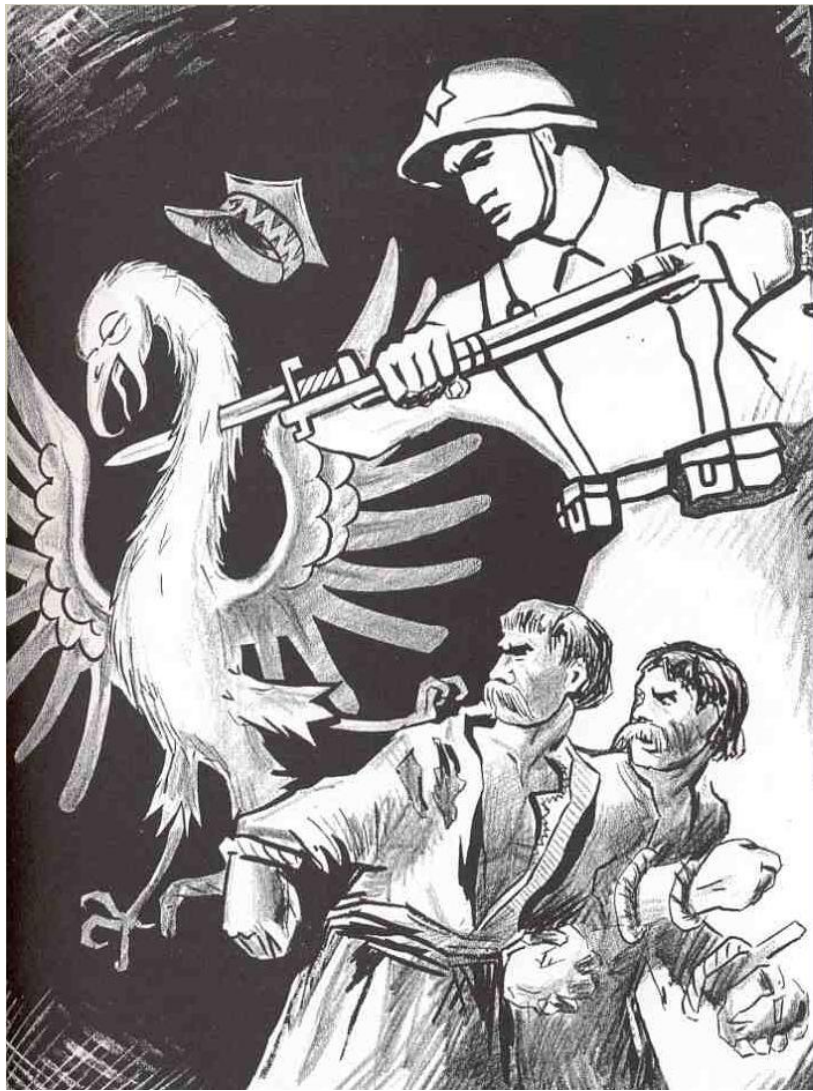
Красноармеец поражает польского орла, освобождая от гнёта украинских и белорусских крестьян Советский плакат (1939)

В прошлом году исполнилось 80 лет значимому в истории Беларуси событию – воссоединению Западной Беларуси с Белорусской Советской Социалистической Республикой (БССР) .