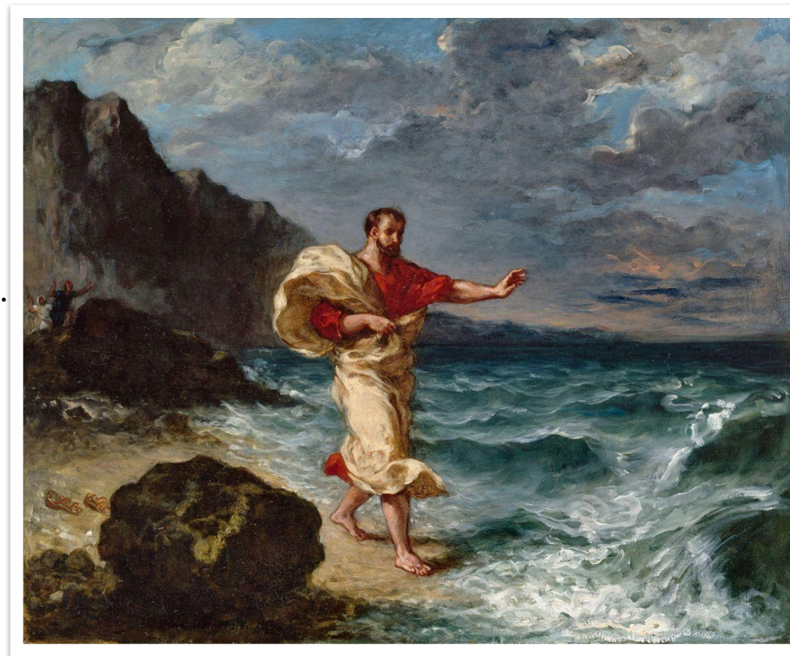
Демосфен говорит с волнами