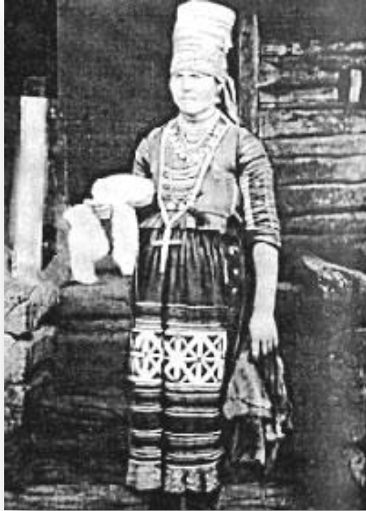
Женщина-эрзянка в costume свахи. Пензенская губерния. Начало XX в.