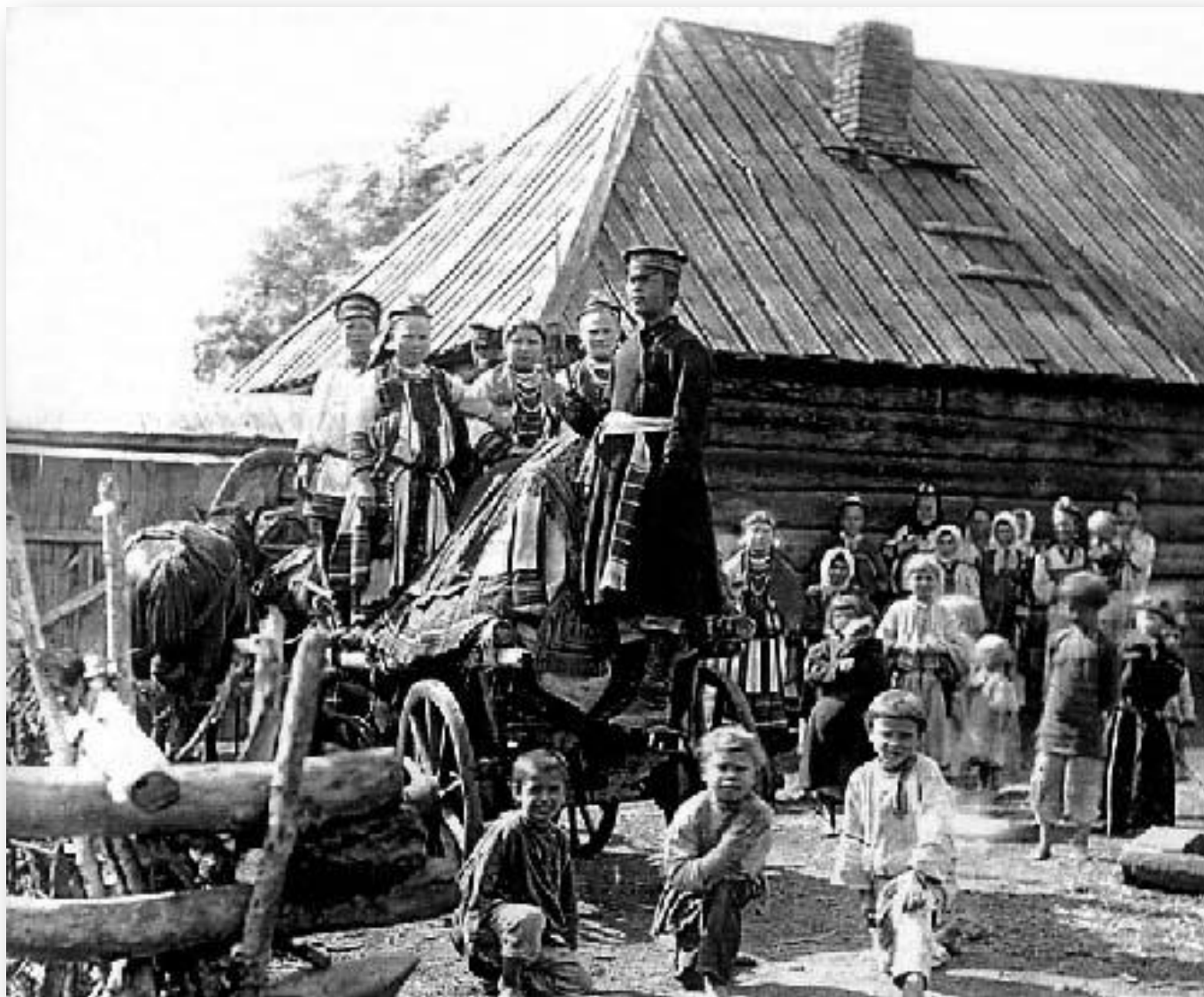
Эрзянская свадьба в Саранском уезде. «Он-ава». Так называлась кибитка, в которой размещалась невеста. Рядом — один из братьев или дядьёв («урваля») с саблей, служившей в качестве оберега от «нечистой силы». начала XX в.