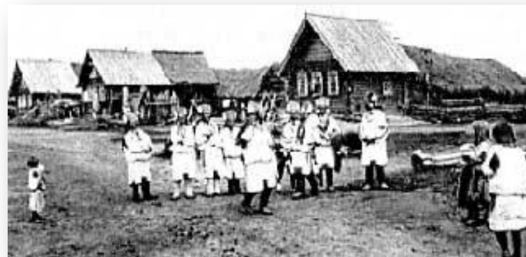
Смотрины приданого. Село Стандрово Темниковского уезда. Начало XX в.

В доме невесты собирались ее родственники, каждый из них приносил с собой подарок (каравай хлеба, полотенце, посуду и т.п.).