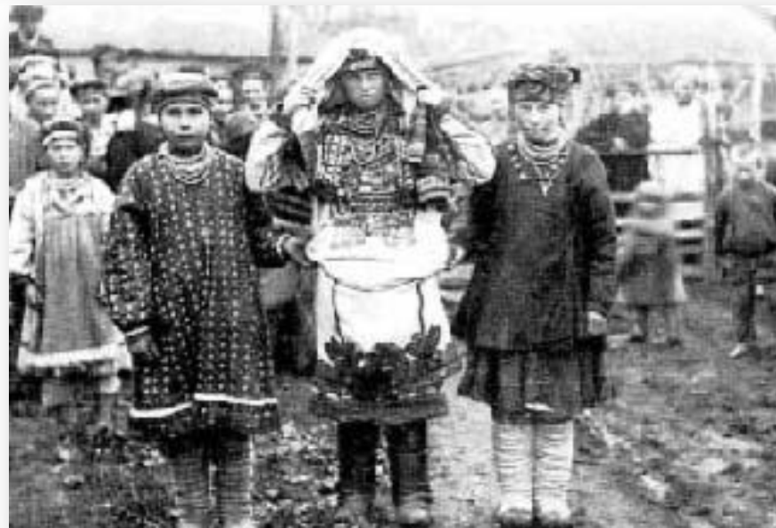
Свадьба в мокшанском селе. Представление невесты Ведяве. Темниковский уезд. начала XX в.