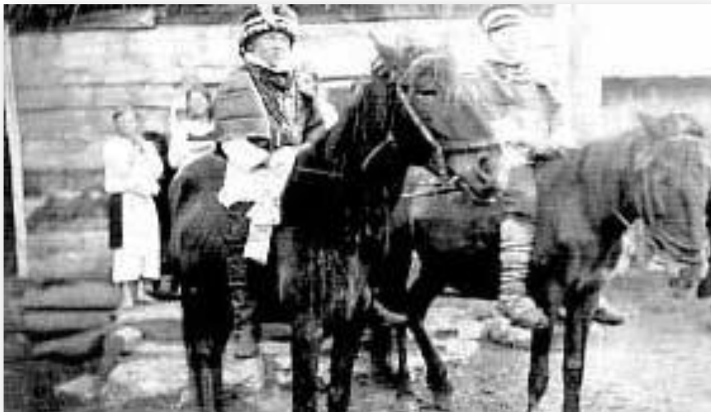
Гонцы с приглашением на эрзянскую свадьбу. Симбирская губерния, конец XIX в.