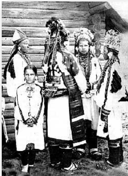
Эрзянская невеста с подругами. Село Стандрово Темниковского уезда Тамбовской губернии. Начало XX в.

Традиционную мордовскую свадьбу можно назвать народной музыкальной драмой, в которой остродраматические эпизоды, связанные с уходом невесты из отчего дома, перемежаются с жизнерадостными сценами, проходящими в доме жениха.