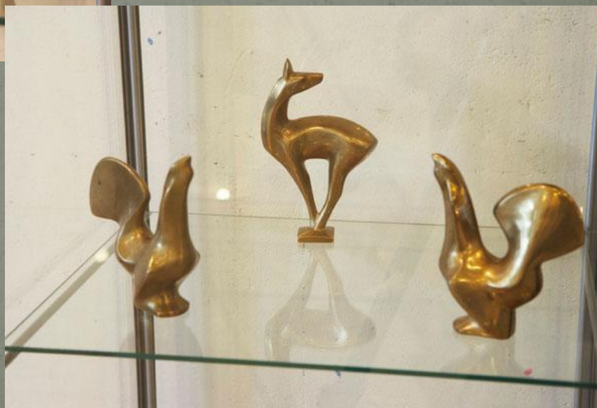
«Петухи и собаки»