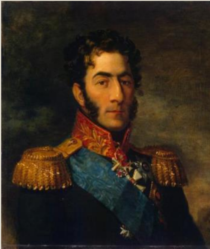
Пётр Иванович Багратион