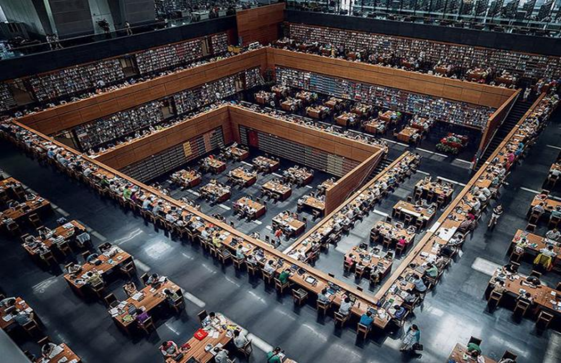
Национальная библиотека Китая, Пекин