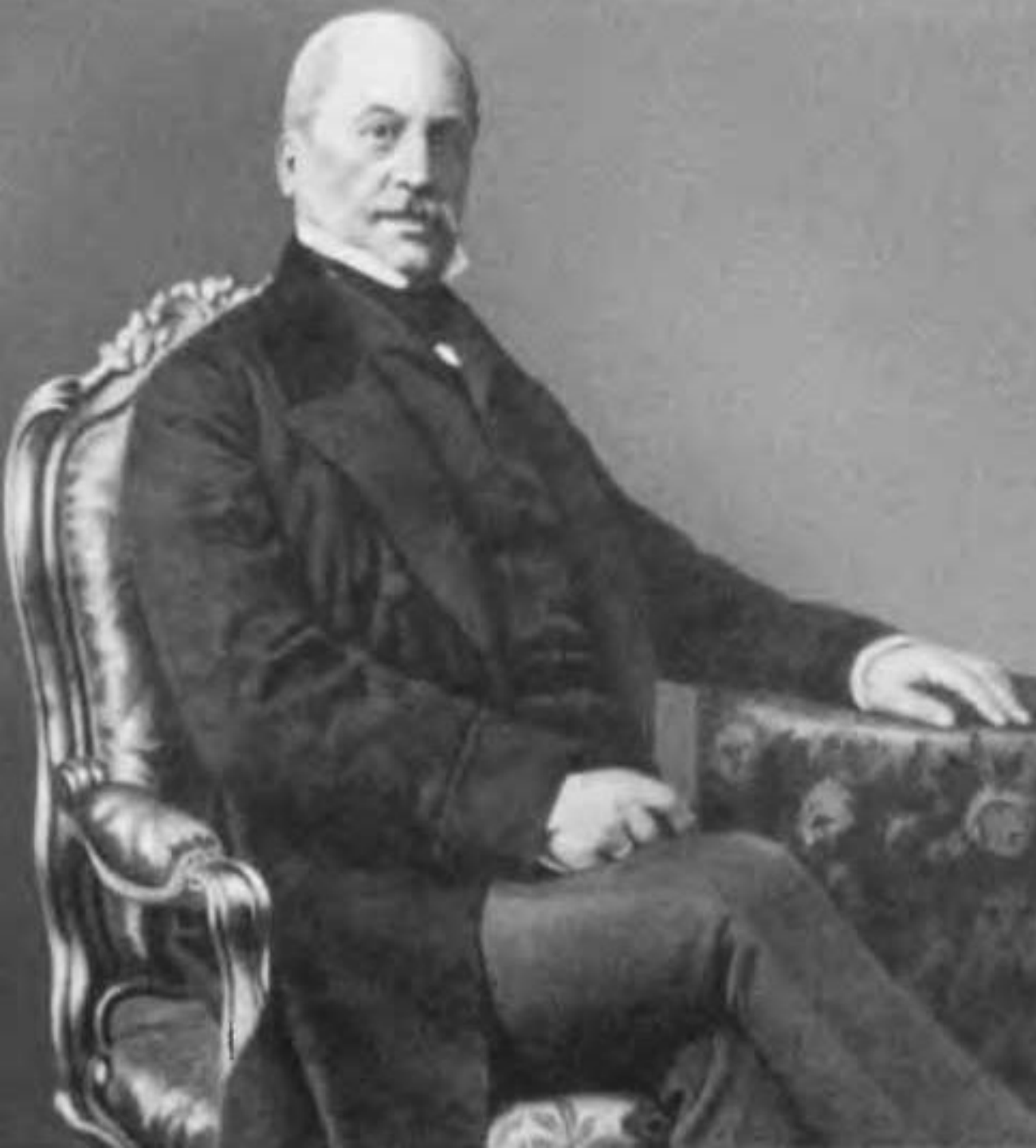
Павел Киселев (1788-1872 г.г.) Глава Пятого отделения Концелярии