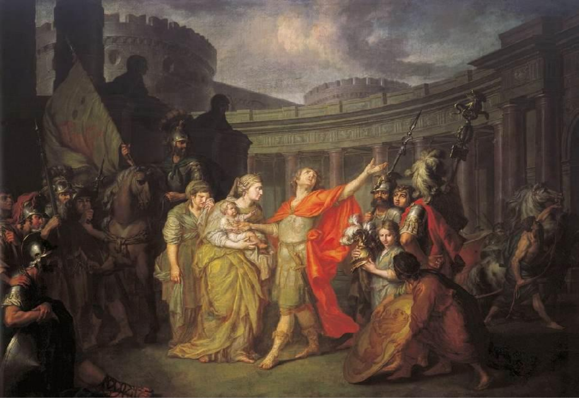
А.П. Лосенко. Прощание Гектора с Андромахой