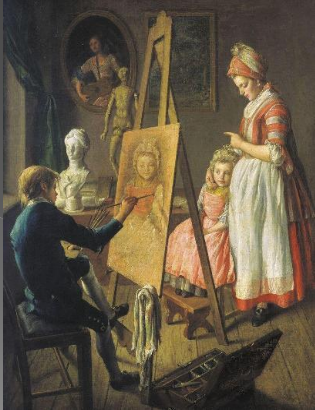
И. Фирсов. Юный живописец.

И под ней оказалась другая, « I. Firsove » - «И.Фирсов»