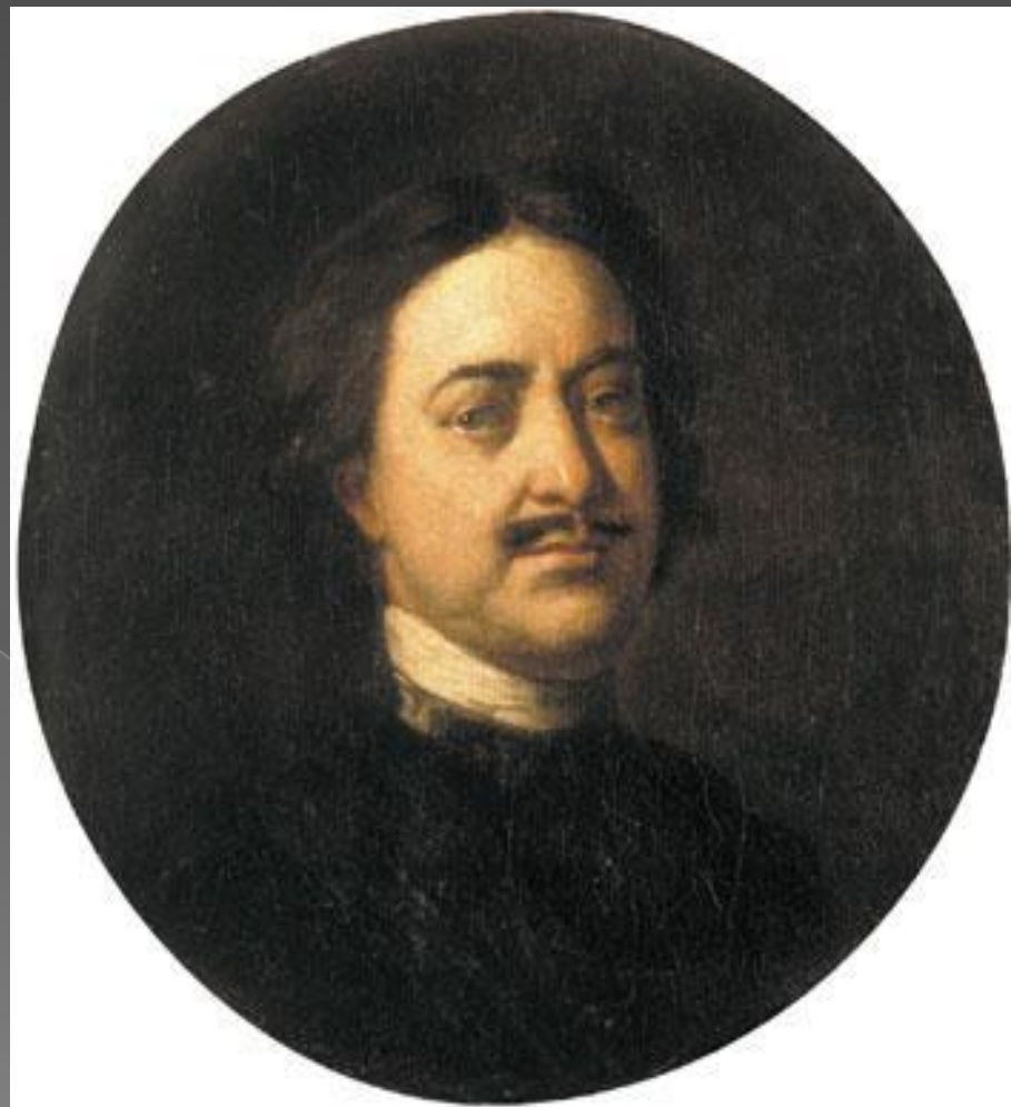
Иван Никитин. Портрет Петра Первого.

Здесь одни портреты. Художники все лучше пишут лицо человека. Они понимают, что лицо может рассказать о натуре человека, о его сложных, изменчивых чувствах.