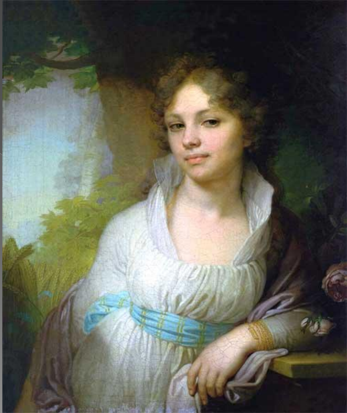
В.Л.Боровиковский. Портрет Лопухиной.