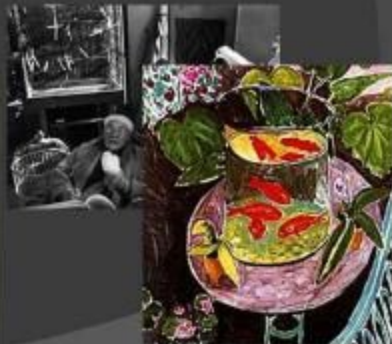
А. МАТИСС «КРАСНЫЕ РЫБКИ»