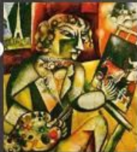
М. ШАГАЛ. «Автопортрет с семью пальцами»