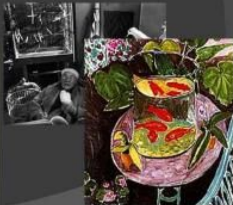
А. МАТИСС «КРАСНЫЕ РЫБКИ»