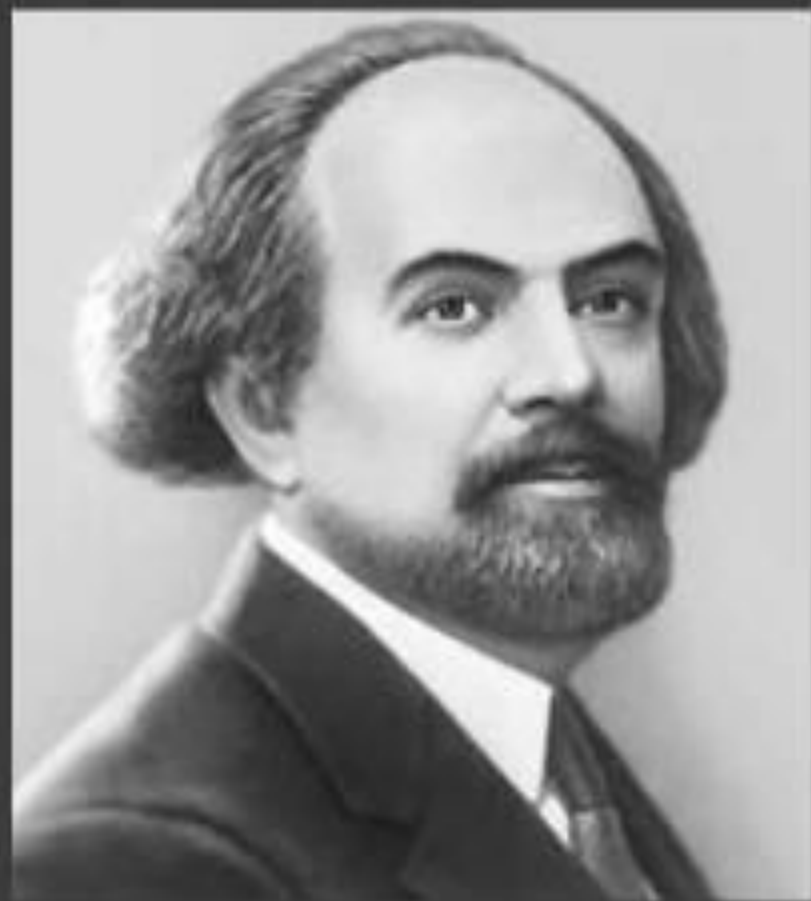
Бердяев Н.А. «Конец Европы»

Первые десятилетия XX в. – ощущения кризиса и распада окружающего мира.