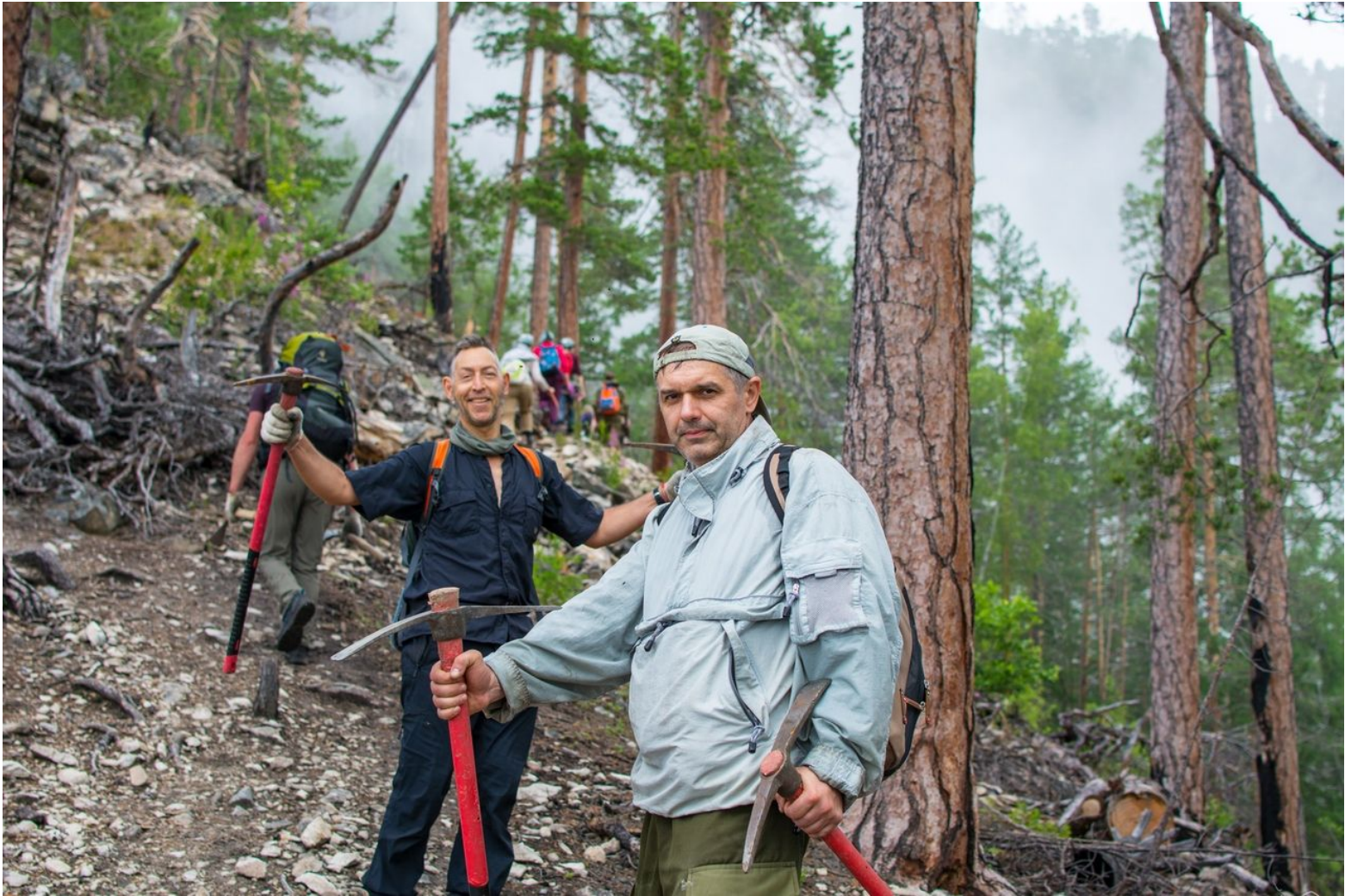
Проект ББТ «Тропа испытаний», июль 2018г, п-ов Святой Нос