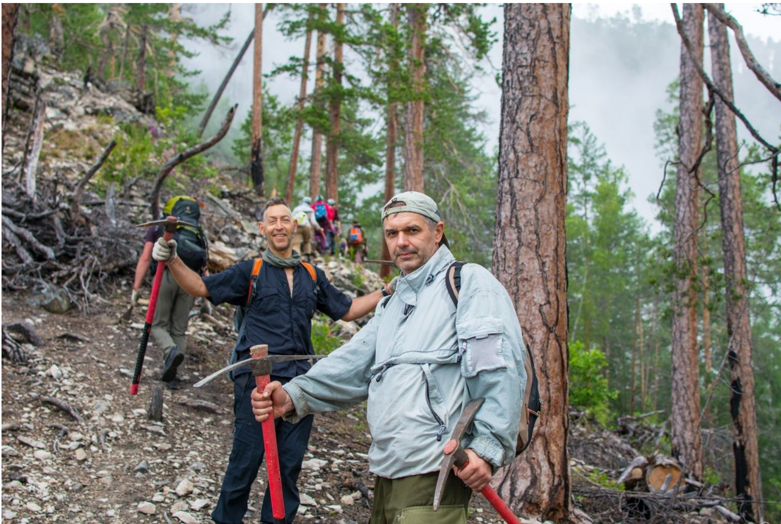
Проект ББТ «Тропа испытаний», июль 2018г, п-ов Святой Нос