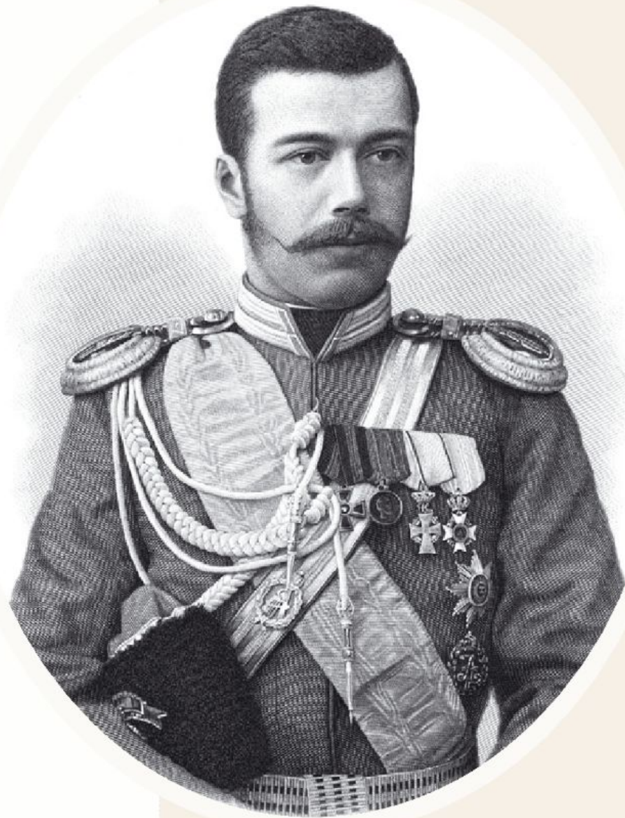
Цесаревич Николай Александрович