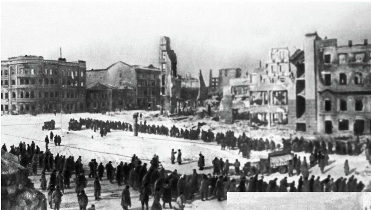
Операция «Уран» г. Сталинград