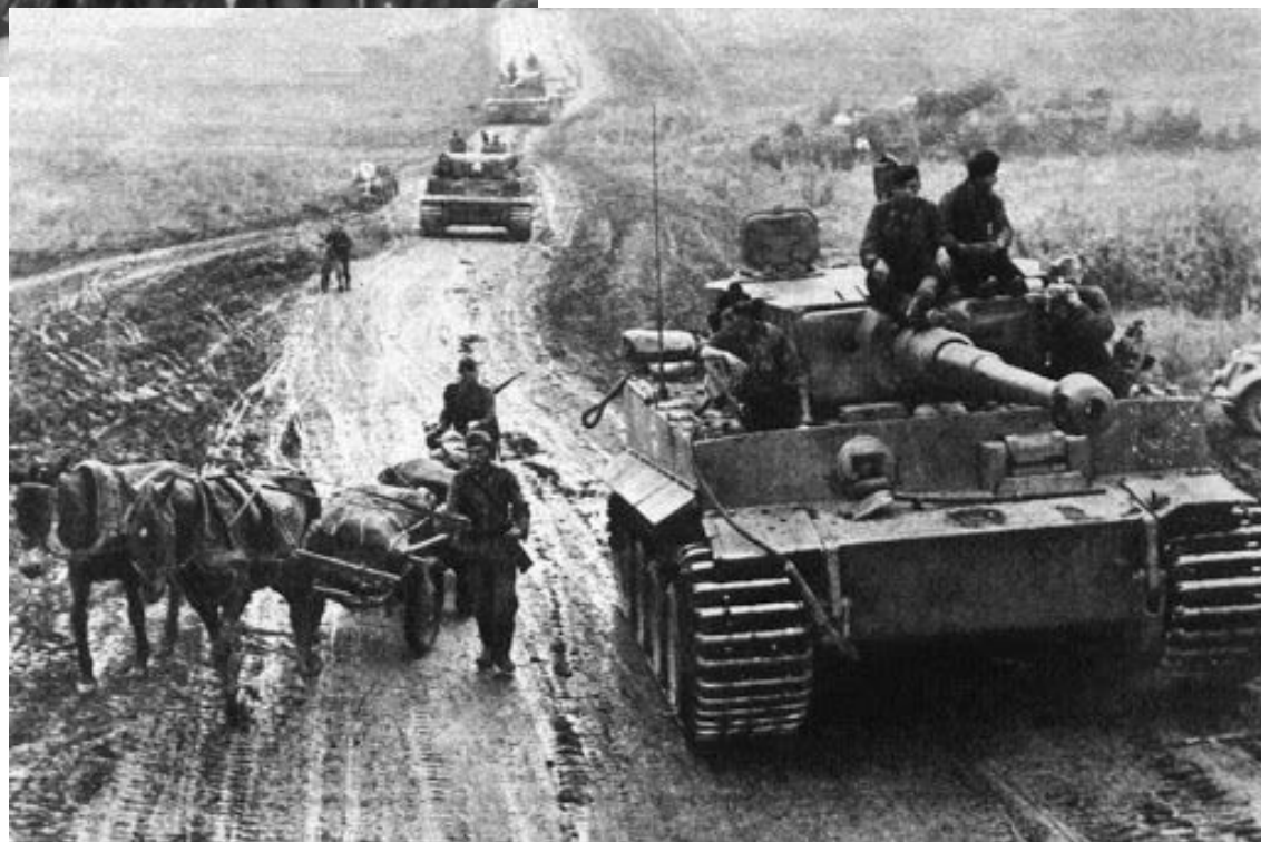
Операция «Цитадель» г. Курск (Курская дуга)