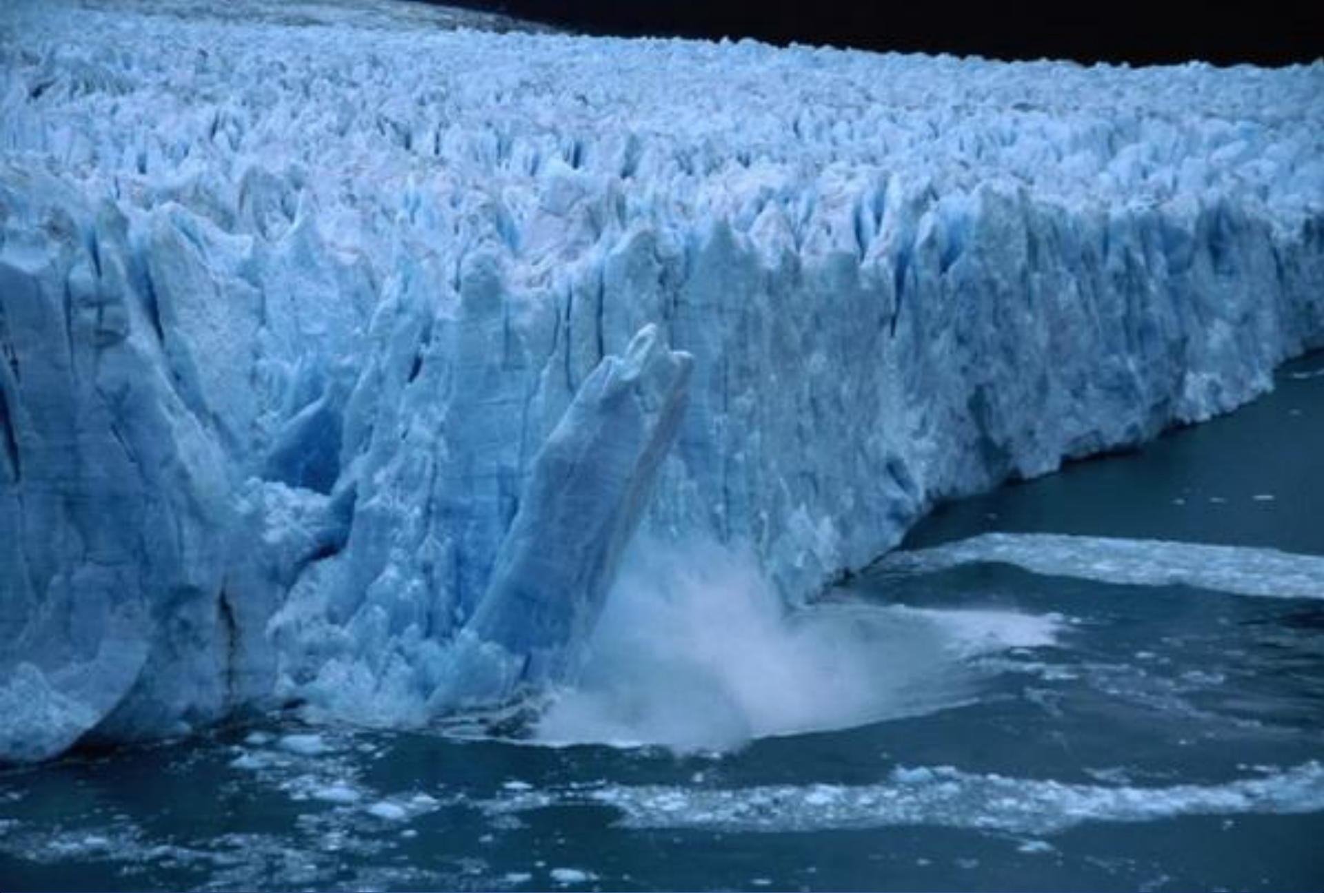
Айсберг откололся от ледника Перито-Морено