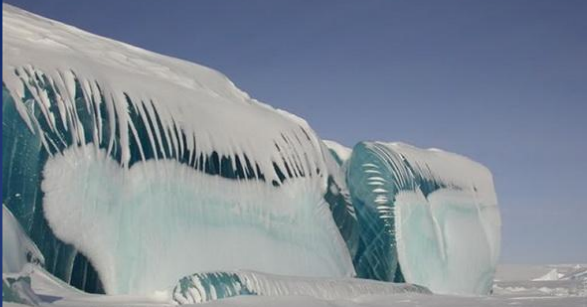
Замерзшая волна от прилива.