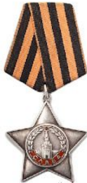
КАВАЛЕРОВ ОРДЕНА СЛАВЫ