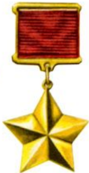
ГЕРОЕВ СОВЕТСКОГО СОЮЗА