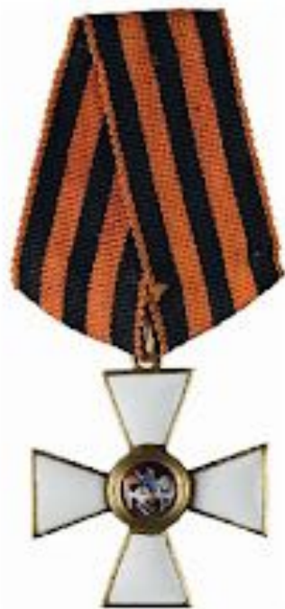
КАВАЛЕРОВ ОРДЕНА СВЯТОГО ГЕОРГИЯ