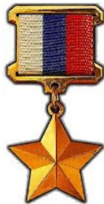
ГЕРОЕВ РОССИЙСКОЙ ФЕДЕРАЦИИ