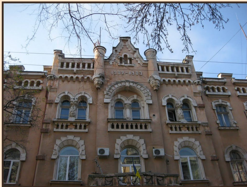
Одесское мореходное училище

В 1930 году поступил в Одесское мореходное училище и, окончив его в 1933 году, ходил третьим и вторым помощником капитана на пароходах «Ильич» и «Красный флот».