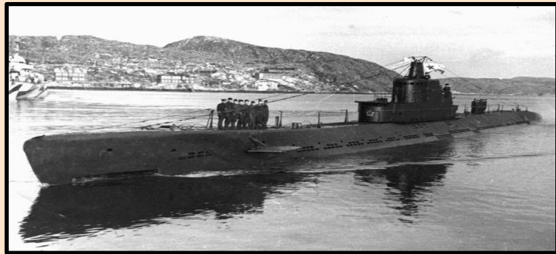
Подводная лодка С-13