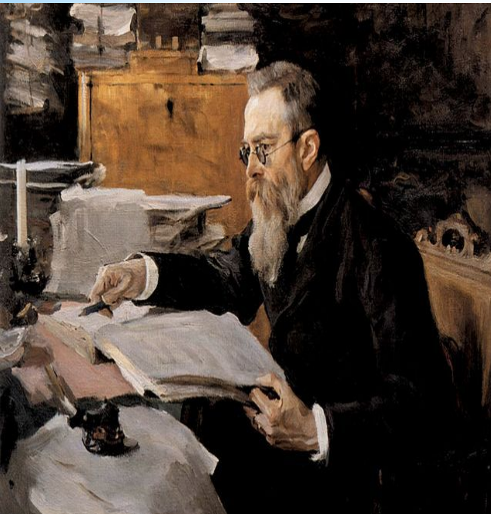
Николай Андреевич Римский- Корсаков