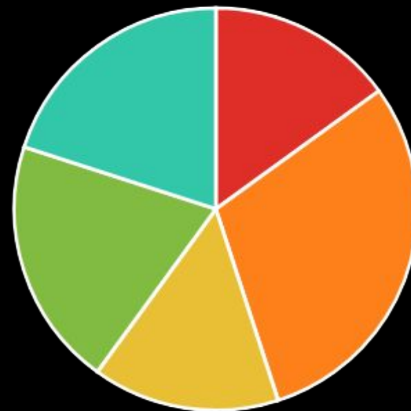
Студенты 2-ого курса