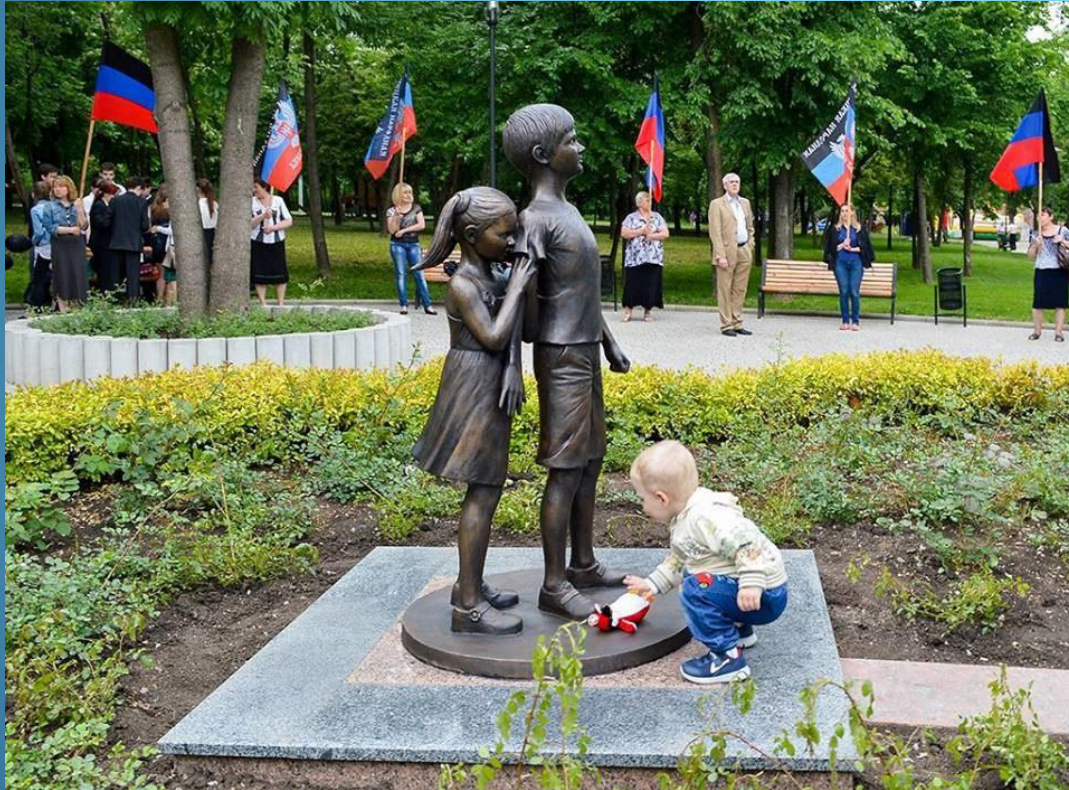
Памятник «Детям Донбасса, детям войны»