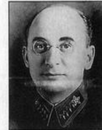
Л. П. Берия — зам. Председателя ГКО