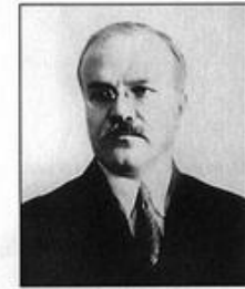
В. М. Молотов — зам. Председателя ГКО