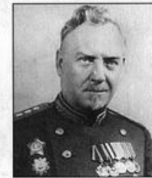
Н. А. Булганин — член ГКО