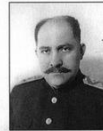
Л. М. Каганович — член ГКО