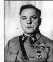
К. Е. Ворошилов — член ГКО