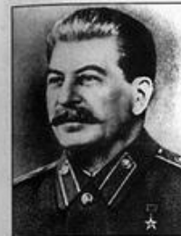
И. В. Сталин — Председатель ГКО