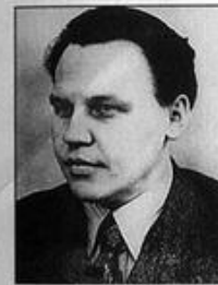
Н. А. Вознесенский — член ГКО