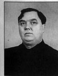
Г. М. Маленков — член ГКО