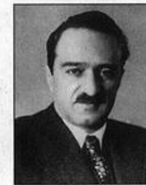
А. И. Микоян — член ГКО