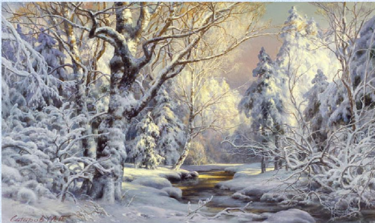
Старов М.А. «Лесная сказка»