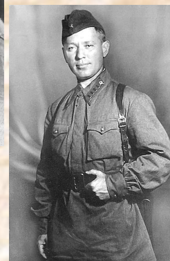
В годы войны.

В судьбе Михаила Александровича Шолохова как писателя, так и человека, отразилась вся противоречивая история нашей страны.