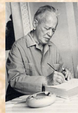
В последние годы жизни.

В судьбе Михаила Александровича Шолохова как писателя, так и человека, отразилась вся противоречивая история нашей страны.