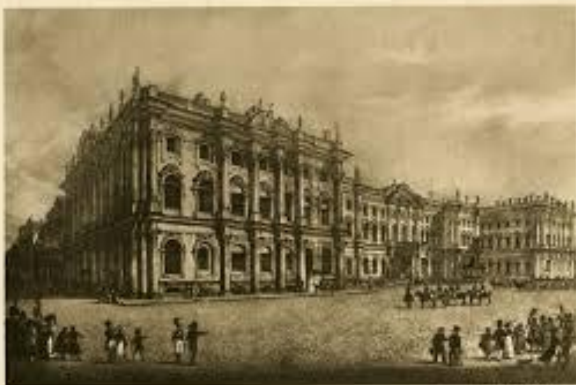
Правительство в Петербурге.

Иллюстрация к описанию Петербурга, составленная в 1812 году. Из собрания Музея.