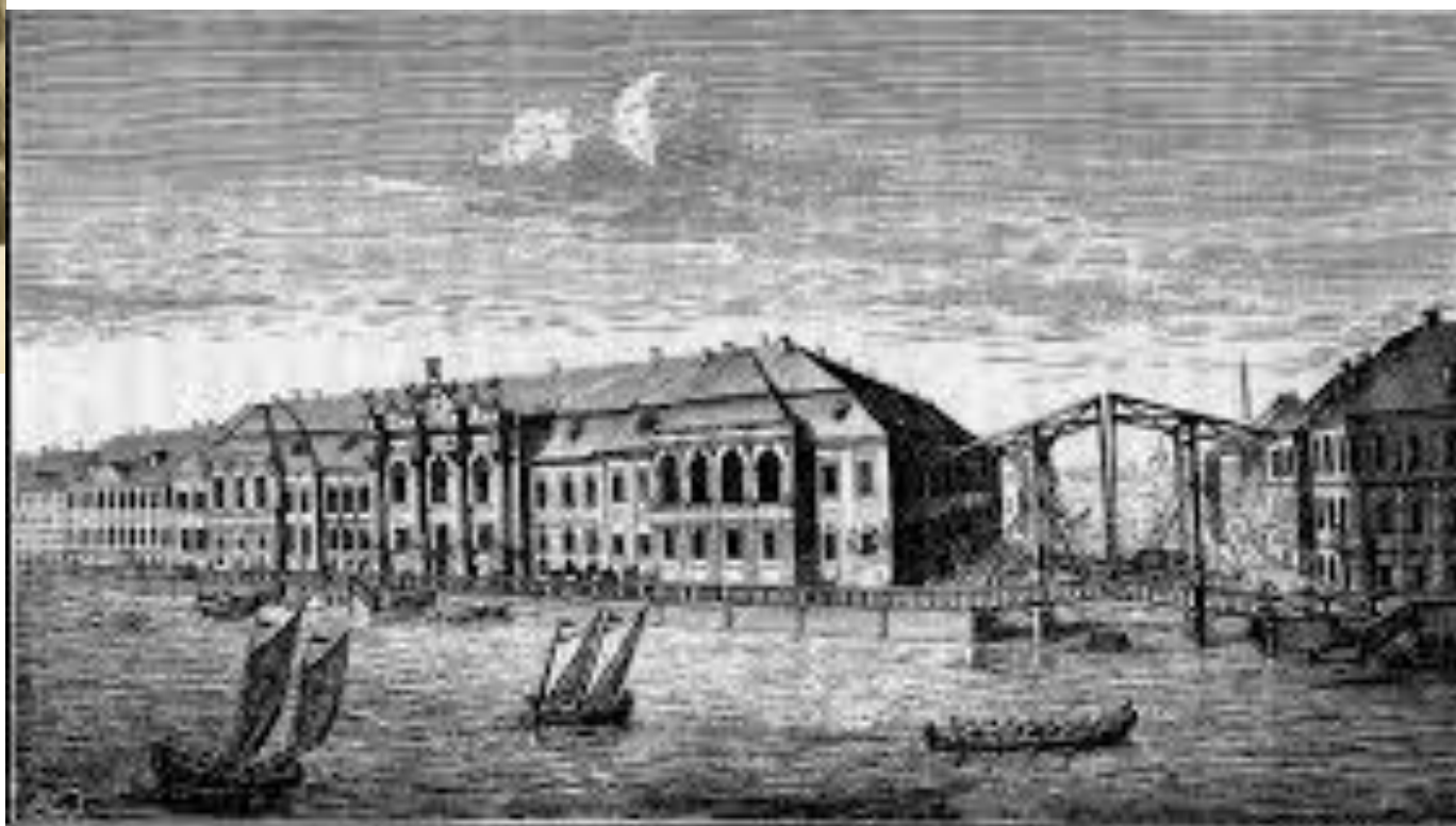
Земля в порту в начале XVIII столетия.

Иллюстрация к описанию Петербурга, составленная в 1812 году. Из собрания Музея.