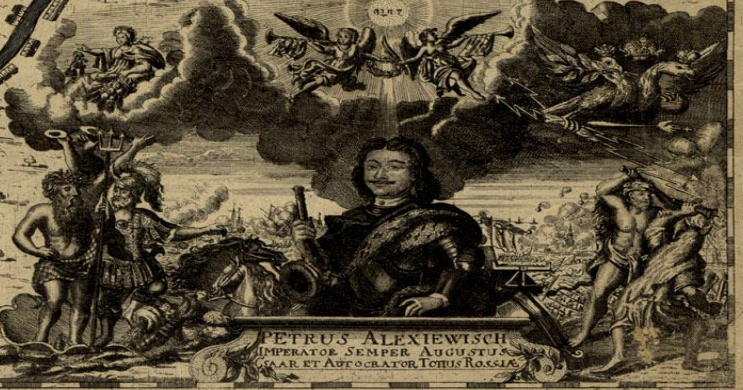
PETRUS ALEXIEWITSCH IMPERATOR SEMPER AUGUSTUS CAESAR ET AUTOCRATOR TOTIUS ROSSIAE