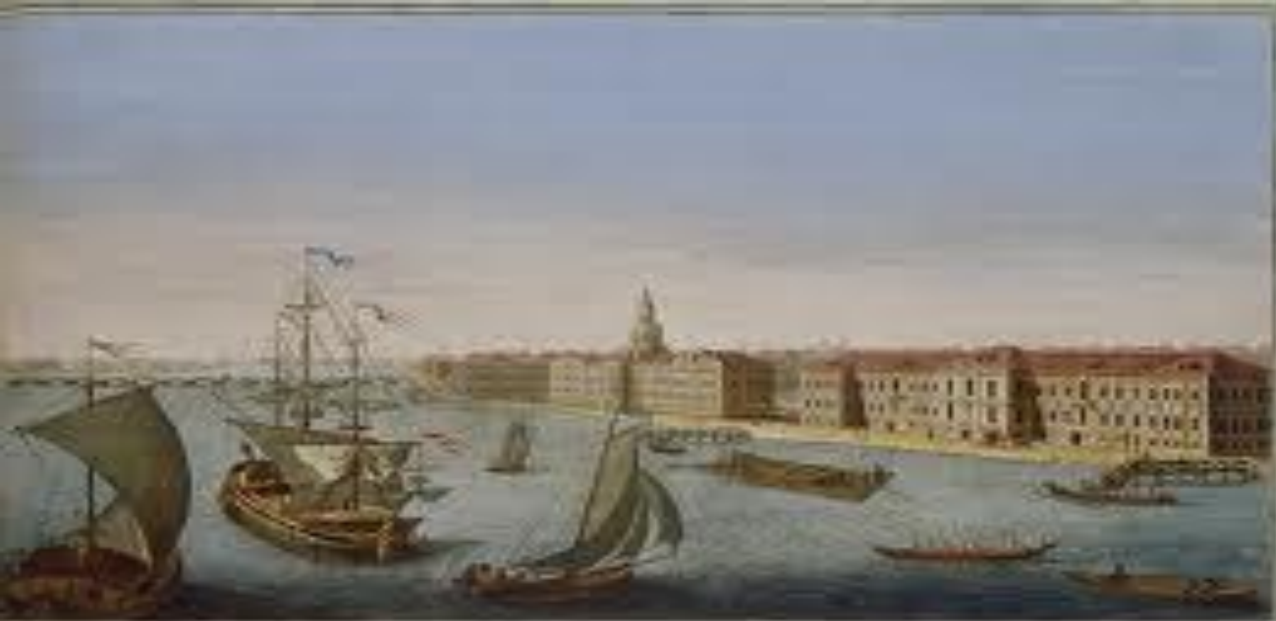
Vue de la ville de la Nouvelle-Orléans, vu de l'océan, avec le Palais et le port de la Nouvelle-Orléans, par le peintre de la Marine, par M. de la Roche.