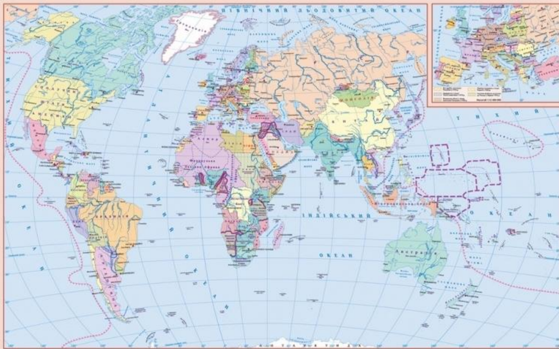
ПОЛІТИЧНА КАРТА СВІТУ ПІСЛЯ ПЕРШОЇ СВІТОВОЇ ВІЙНИ (на 1923р.)

Політична карта -це географічна карта, на якій відображено територіально-політичний поділ світу, материків або окремих регіонів.