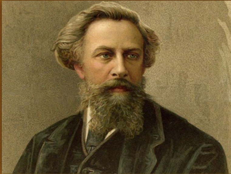
Алексей Константинович Толстой