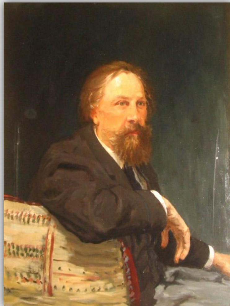
А.К. Толстой. Посмертный портрет. Холст, масло. Худ. И.Е. Репин. 1879г..

Многие стихотворения Толстого по построению и языку близки к песне. Десятки из них положены на музыку М.А. Балакиревым, Н.А. Римским-Корсаковым, П.И. Чайковским, М.П. Мусоргским, А.Г. Рубинштейном, Ц.А. Кюи, С. И. Танеевым.