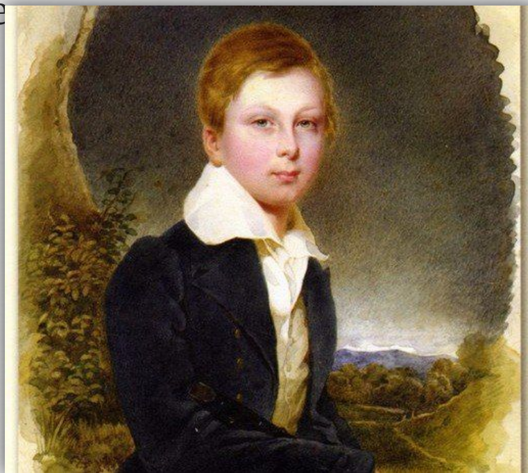
Алеша Толстой. Акварель Фальтена