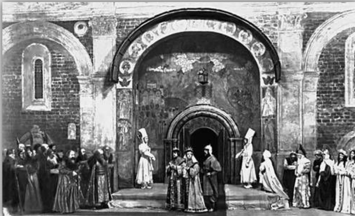
Сцена из спектакля «Царь Фёдор Иоаннович» А. К. Толстого. Первый спектакль Московского Художественного театра. 1898.

В 1898 году постановкой драмы А. К. Толстого «Царь Фёдор Иоаннович» открылся Московский Художественный театр.