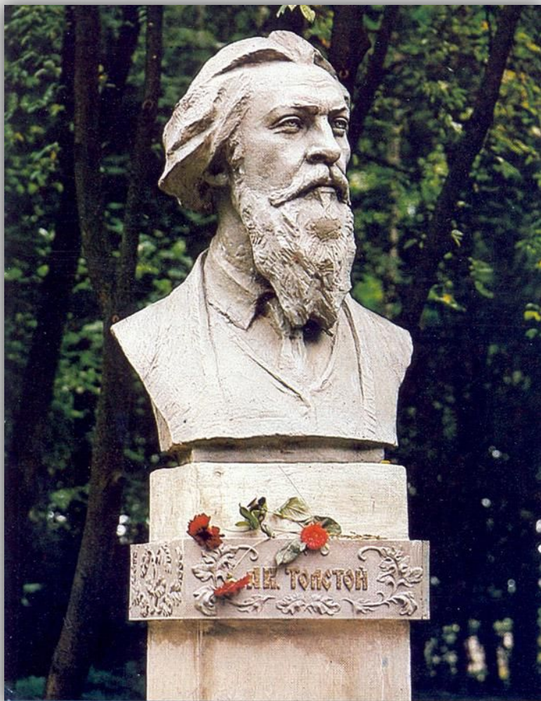
Бюст А.К. Толстого в усадьбе Красный Рог. Скульптор Н.Н. Козлова.