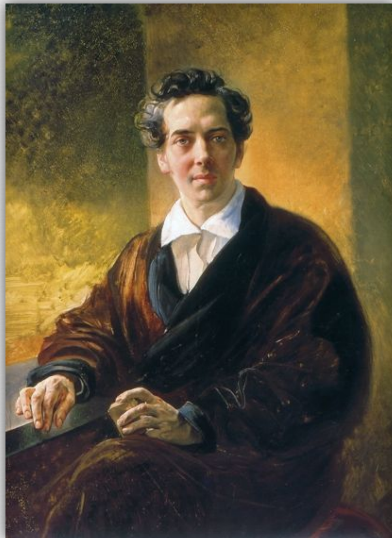
Портрет графа Перовского – писателя Антония Погорельского. Художник Брюллов Карл Павлович

Вместо отца Алексея воспитывал дядя по матери А. А. Перовский (Антон Погорельский), сочинивший для племянника сказку «Чёрная курица» о приключениях мальчика по имени Алёша.