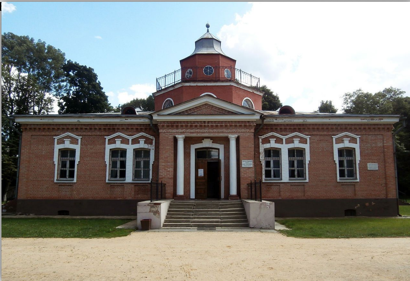
Дом-музей А. К. Толстого в имени Красный Рог

Музей-усадьба Алексея Толстого расположена в Красном Роге. Здесь граф провёл детские годы, неоднократно возвращался в эти места в зрелом возрасте, здесь же и был похоронен. Детей не оста