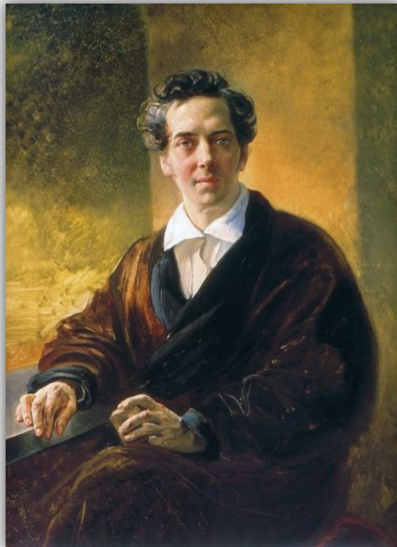
Портрет графа Перовского – писателя Антония Погорельского. Художник Брюллов Карл Павлович

Вместо отца Алексея воспитывал дядя по матери А. А. Перовский (Антон Погорельский), сочинивший для племянника сказку «Чёрная курица» о приключениях мальчика по имени Алёша.