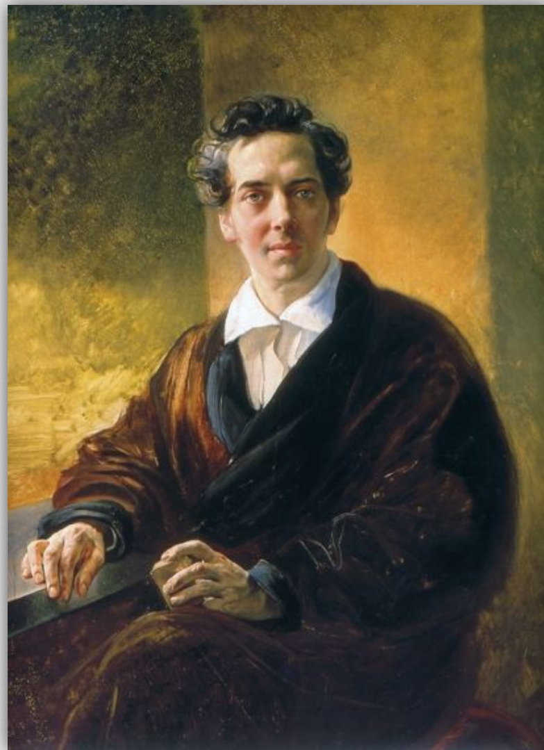
Портрет графа Перовского – писателя Антония Погорельского. Художник Брюллов Карл Павлович

Вместо отца Алексея воспитывал дядя по матери А. А. Перовский (Антон Погорельский), сочинивший для племянника сказку «Чёрная курица» о приключениях мальчика по имени Алёша.