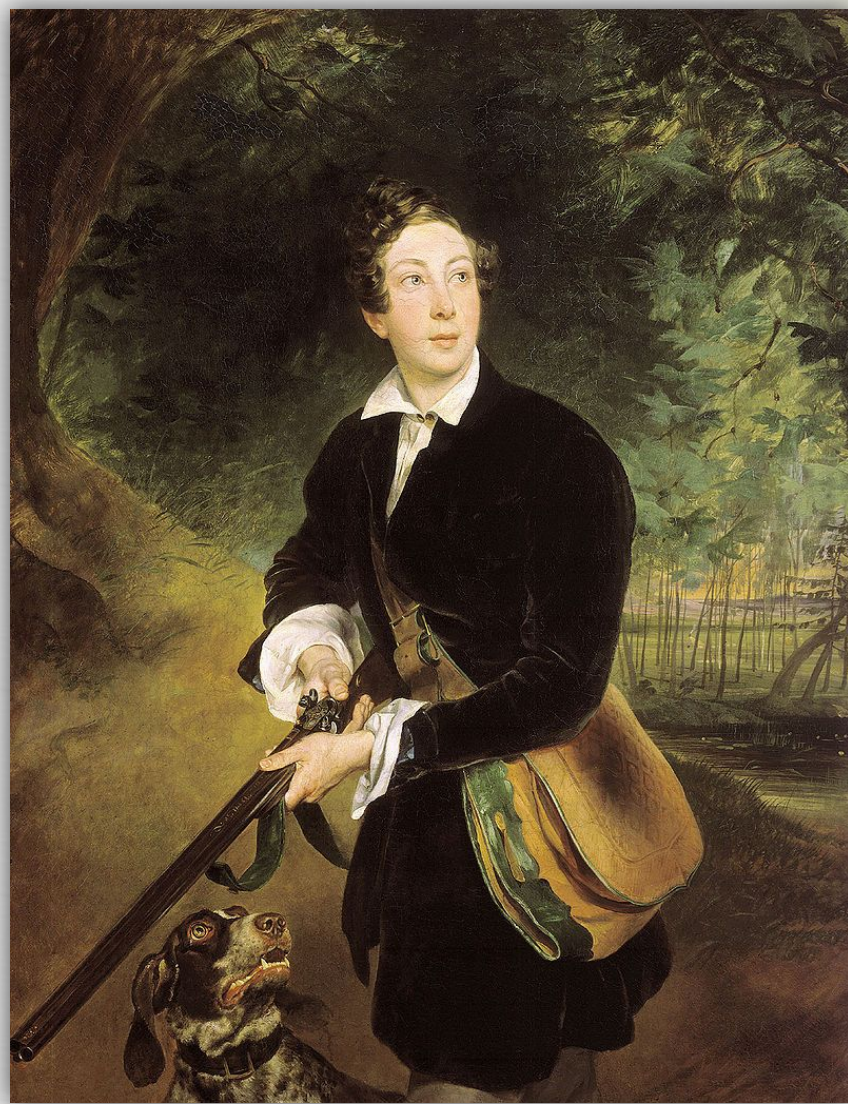
Алексей Толстой. Портрет 1836 г. Художник К.П. Брюллов

В 1834 году Толстого определили «студентом» в московский архив Министерства иностранных дел. С 1837 года он служил в русской миссии при германском сейме во Франкфурте-на-Майне, в 1840 году получил службу в Петербурге при царском дворе, в 1843-м — придворное звание камер-юнкера. В дальнейшем был пожалован придворными званиями «в должности церемониймейстера» (1851) и «в должности егермейстера» (1861).