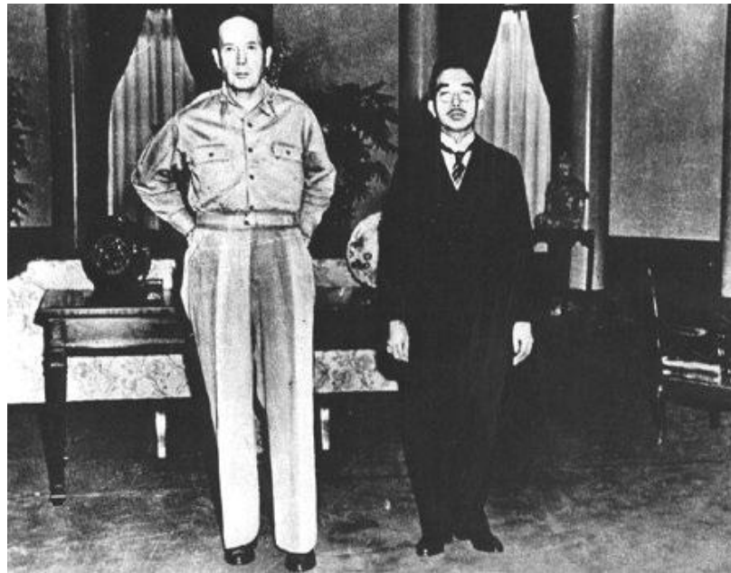
Император Хирохито и глава оккупационных сил генерал Макартур. 1945 г.

После войны в оккупированной американскими войсками Японии проводятся реформы , которые должны были ликвидировать милитаристско-фашистские порядки. Американская администрация сделала многое для принятия Японией Конституции , вступившей в силу 3 мая 1947 года .