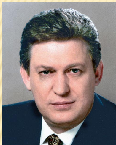
Председатель Совета Федерации ФС РФ Владимир Филиппович Шумейко, 1994 г.

Конституция РФ 1993 года закрепила статус Федерального Собрания - двухпалатного парламента России, определила вопросы ведения и полномочия Совета Федерации. В состав СФ входят по 2 представителя от каждого субъекта РФ: по одному от представительного и исполнительного органа субъекта РФ