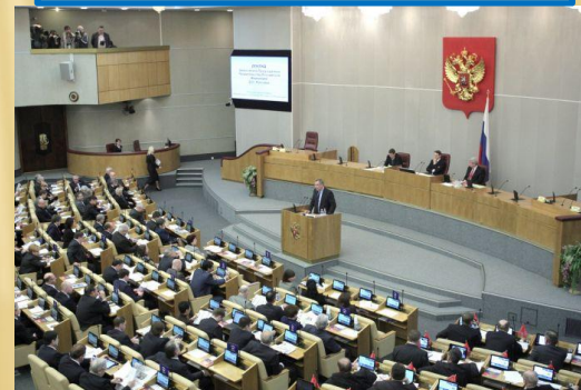
Государственная Дума VI созыва, 2011 г.