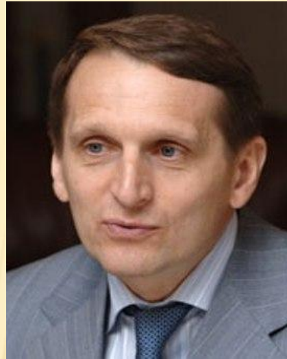
Председатель Государственной Думы ФС РФ Сергей Евгеньевич Нарышкин