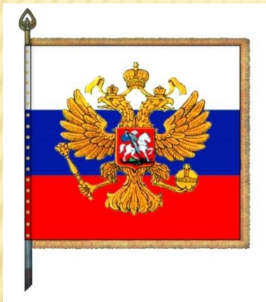
Штандарт Президента Российской Федерации