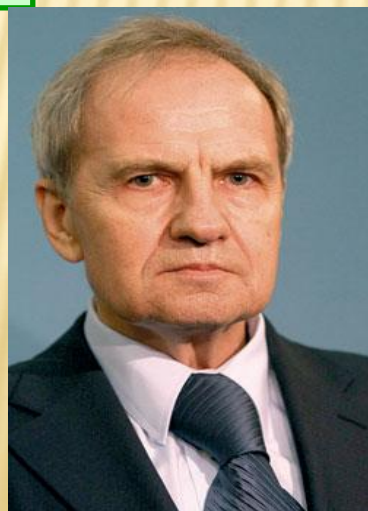
Председатель Конституционного суда РФ Валерий Дмитриевич Зорькин