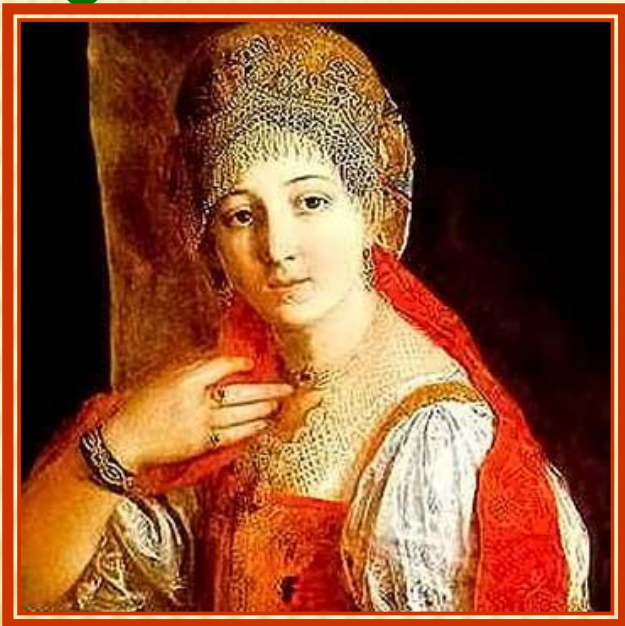
Елена Глинская, мать Иоанна Грозного, 1508 — 1538

Губная реформа — реформа в Русском государстве в части местного управления, произведённая в XVI веке во время правления матери Ивана IV Елены Глинской. Реформа была вызвана обострением социальной борьбы. Выборные губные учреждения образовывались для преследования разбойников и суда над ними, также решали дела о воровстве, заведовали тюрьмами и регистрировали приезжих и проезжающих людей. «Выборный голова» (губной староста) был из местных детей боярских. В помощь им из зажиточных крестьян избирались губные целовальники