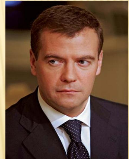
Председатель Правительства РФ Дмитрий Анатольевич Медведев