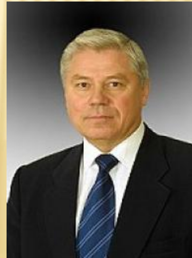
Председатель Верховного суда РФ Вячеслав Михайлович Лебедев