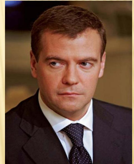
Председатель Правительства РФ Дмитрий Анатольевич Медведев