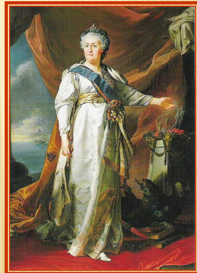
Екатерина Великая (1729 -1796), Императрица Всероссийская (с 1762 по 1796 гг.)

Документами, определившими направление новой губернской и городской реформы, стали принятые в 1775 году «Учреждения для управления губерний Всероссийской империи» и «Жалованная Грамота на права и выгоды городам Российской империи»