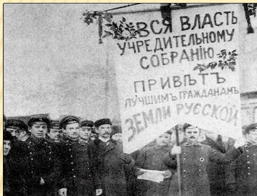
Предвыборная агитация на выборах

Февральская революция 1917 г. положила начало новому этапу в истории российского избирательного права. Демократическим путем избраны органы земского и городского самоуправления, 12 ноября 1917 года проведены выборы во Всероссийское Учредительное Собрание