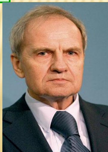
Председатель Конституционного суда РФ Валерий Дмитриевич Зорькин