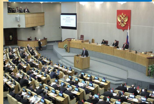
Государственная Дума VI созыва, 2011 г.