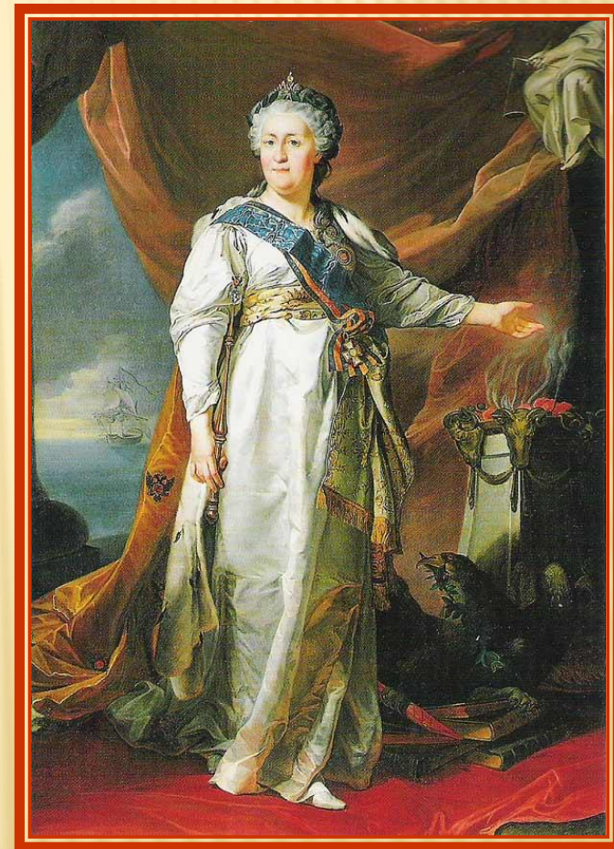
Екатерина Великая (1729 -1796), Императрица Всероссийская (с 1762 по 1796 гг.)

Документами, определившими направление новой губернской и городской реформы, стали принятые в 1775 году «Учреждения для управления губерний Всероссийской империи» и «Жалованная Грамота на права и выгоды городам Российской империи»