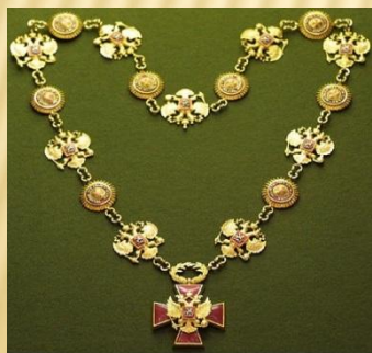
Знак Президента Российской Федерации