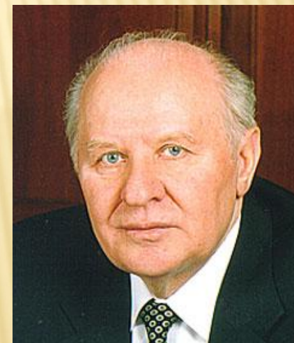
Председатель Совета Федерации ФС РФ Егор Семенович Строев, 1996 г.

Конституция РФ 1993 года закрепила статус Федерального Собрания - двухпалатного парламента России, определила вопросы ведения и полномочия Совета Федерации. В состав СФ входят по 2 представителя от каждого субъекта РФ: по одному от представительного и исполнительного органа субъекта РФ