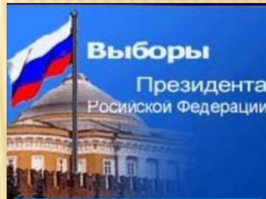
Выборы в современной России