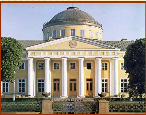
Таврический дворец, где проходили заседания Государственных Дум I - IV созывов

Крестьянский вопрос оставался центральным, предлагались законопроекты по развитию свободного фермерского хозяйства на свободной земле. Столыпин обвинил 55 социал-демократов в заговоре с целью установления республики. 3 июня 1907 г. царь подписал манифест о роспуске Думы и об изменении избирательного закона