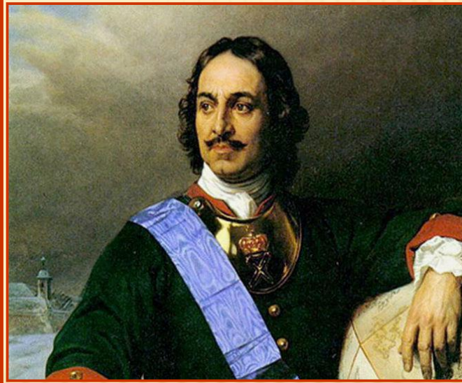
Петр I (1672-1725), последний царь всея Руси (с 1682 г.) и первый Император Всероссийский (1721 -1725)

По указу Петра I в 1708 году, введено трехзвенное административное деление: губерния - провинция - уезд, империя разделялась на 8 губерний: Московская, Смоленская, Азовская, Казанская, Архангелогородская, Сибирская, Киевская и Ингерманландская (через 2 года Санкт-Петербургская). Ими управляли губернаторы, назначавшиеся царем. Они получали военную, административную, судебную власть, управляли финансами