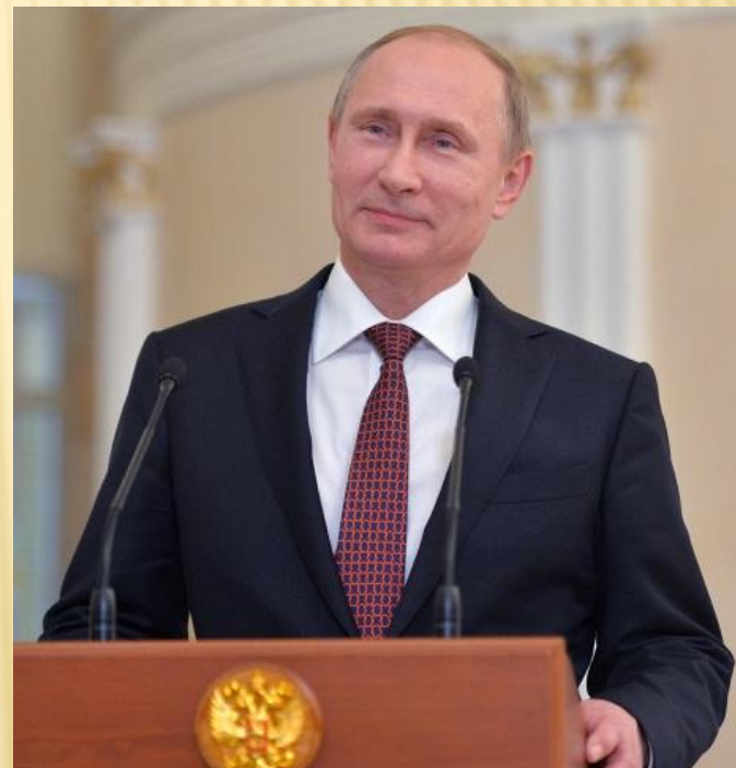
Президент Российской Федерации Владимир Владимирович Путин