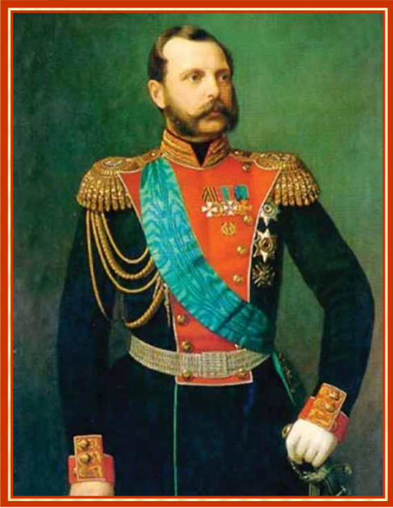
Александр II, Император Всероссийский (1818—1881)

Земская реформа — одна из либеральных «великих» реформ Александра II, предусматривавшая создание системы местного самоуправления в сельской местности — земских учреждений