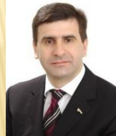
Член Совета Федерации ФС РФ А.И. Голушко – от Законодательного Собрания Омской области, 2012 г.)

В ноябре 2012 года – новый Федеральный закон о Совете Федерации. Представителем от законодательного (представительного) органа государственной власти субъекта РФ может быть депутат этого органа. При проведении выборов высшего должностного лица субъекта РФ каждый кандидат на должность представляет в избирательную комиссию 3 кандидатуры, одна из которых в случае избрания кандидата будет наделена полномочиями члена СФ от исполнительного органа власти.