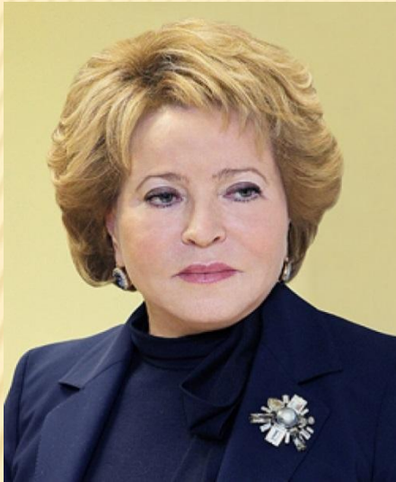
Председатель Совета Федерации ФС РФ Валентина Ивановна Матвиенко