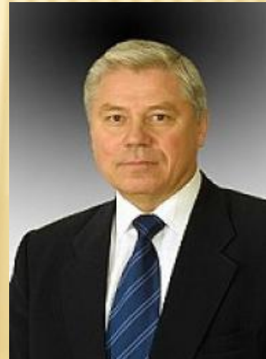
Председатель Верховного суда РФ Вячеслав Михайлович Лебедев