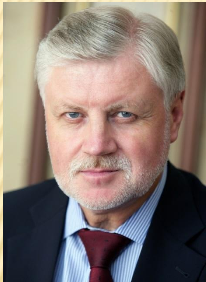
Председатель Совета Федерации ФС РФ Сергей Михайлович Миронов, 2001 г.

2000 год – новый Федеральный закон «О порядке формирования Совета Федерации Федерального Собрания Российской Федерации». Представитель в СФ от исполнительного органа государственной власти субъекта РФ назначался высшим должностным лицом субъекта РФ на срок его полномочий, представитель от законодательного (представительного) органа государственной власти субъекта РФ избирался законодательным (представительным) органом государственной власти субъекта РФ на срок полномочий этого органа