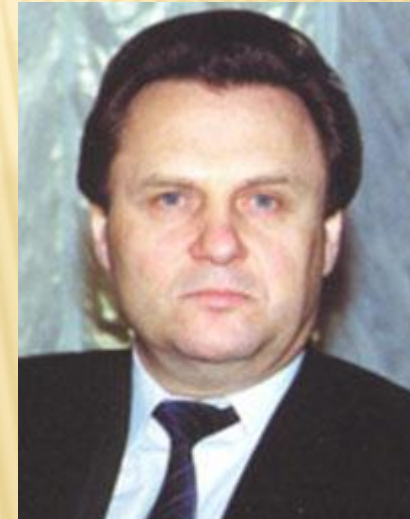
Председатель Государственной Думы ФС РФ Иван Петрович Рыбкин, 1994 г.

225 будущих народных представителей избирались по единому общефедеральному округу от зарегистрированных списков общероссийских политических партий и общественных объединений, 225 - по одномандатным избирательным округам.