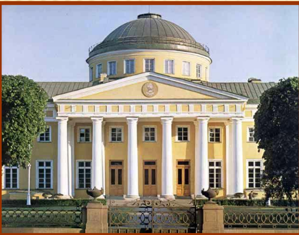
Таврический дворец, где проходили заседания Государственных Дум I - IV созывов

Крестьянский вопрос оставался центральным, предлагались законопроекты по развитию свободного фермерского хозяйства на свободной земле. Столыпин обвинил 55 социал-демократов в заговоре с целью установления республики. 3 июня 1907 г. царь подписал манифест о роспуске Думы и об изменении избирательного закона