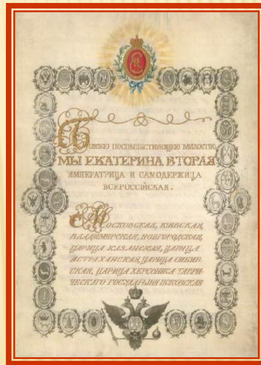
Титульный лист «Грамота на права и выгоды городам Российской империи»

При губернаторе учреждалось губернское правление, как совещательный орган, и должность вице-губернатора, возглавлявшего Казенную палату - орган местного финансового управления