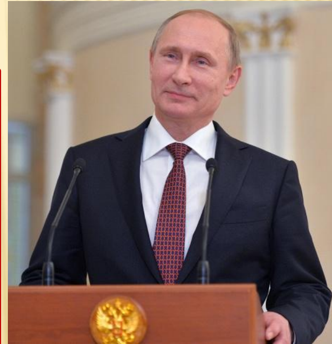
Президент Российской Федерации Владимир Владимирович Путин