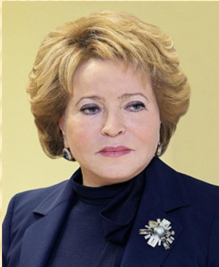
Председатель Совета Федерации ФС РФ Валентина Ивановна Матвиенко