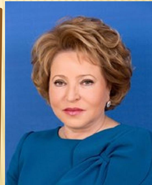
Председатель Совета Федерации ФС РФ Валентина Ивановна Матвиенко, 2011 г.

2000 год – новый Федеральный закон «О порядке формирования Совета Федерации Федерального Собрания Российской Федерации». Представитель в СФ от исполнительного органа государственной власти субъекта РФ назначался высшим должностным лицом субъекта РФ на срок его полномочий, представитель от законодательного (представительного) органа государственной власти субъекта РФ избирался законодательным (представительным) органом государственной власти субъекта РФ на срок полномочий этого органа