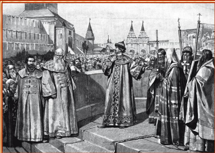
Царь Иоанн IV открывает первый Земский собор своею покаянною речью

Особое место среди органов государственной власти занимают Земские соборы , просуществовавшие 150 лет, являвшиеся сословно-представительным органом, сформировавшимся по принципу участия, по должности и общественно-политическому положению, а также по принципу выборного территориального и сословного делегирования