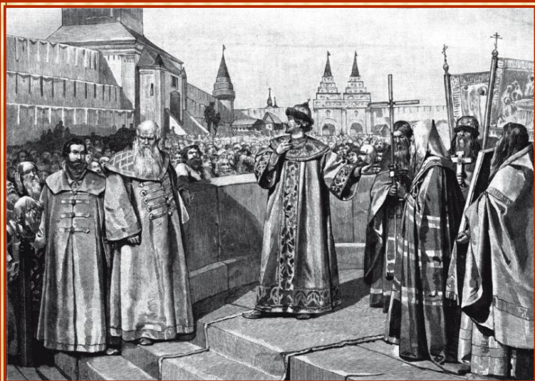
Царь Иоанн IV открывает первый Земский собор своей покаянной речью

Особое место среди органов государственной власти занимают Земские соборы , просуществовавшие 150 лет, являвшиеся сословно-представительным органом, сформировавшимся по принципу участия, по должности и общественно-политическому положению, а также по принципу выборного территориального и сословного делегирования