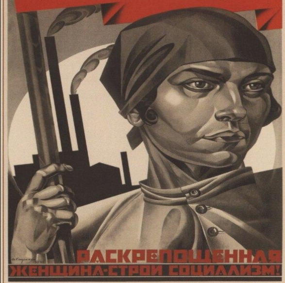
83. Страхов-Браславский А. Раскрепощенная женщина — строй социализм! 1926