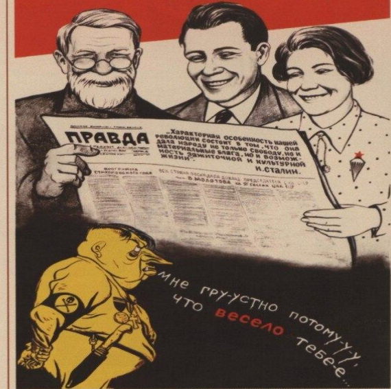
100. Ефимов Б., Иоффе М. Жить стало лучше, жить стало веселее! 1936