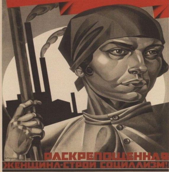
83. Страхов-Браславский А. Раскрепощенная женщина — строй социализм! 1926