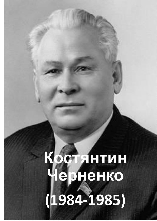
Костянтин Черненко (1984-1985)

Обидва керівники обіймали найвищі посади в похилому віці, хворіли й невдовзі вмирили. Це посилювало в людей відчуття абсурду при владі. Падіння відчувалося на всіх рівнях.