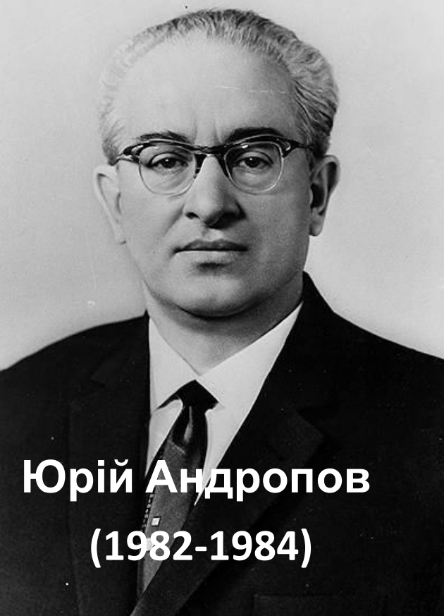
Юрій Андропов (1982-1984)