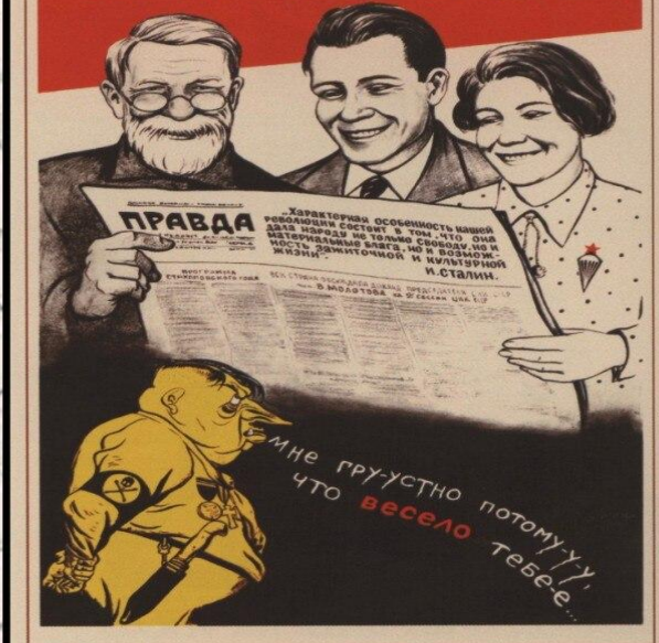
100. Ефимов Б., Иоффе М. Жить стало лучше, жить стало веселее! 1936