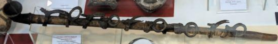
Дървен снопострел 19 век