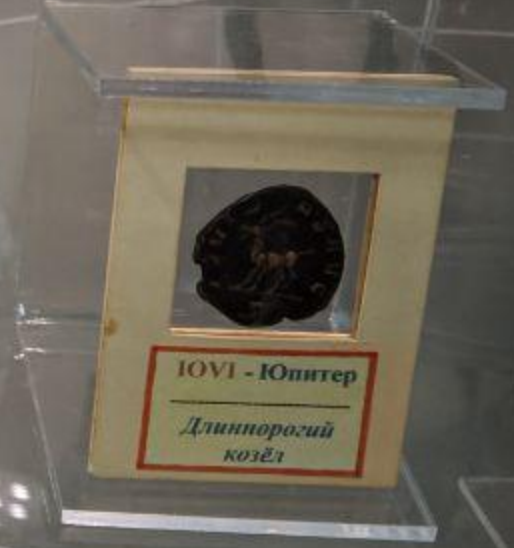
МОНЕТА - АНТОНИНИА Римская Империя, III век н.э., медь л.с. император Галлиен (253-268 гг.) император в лучевой короне - символ Солн о.с. Длинноногий козёл - Юпитер