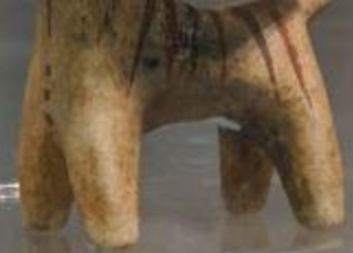
XIV-XIII вв. до н.э. (позднееэлладский период) Афины, Cycladic Art Museum (копия)