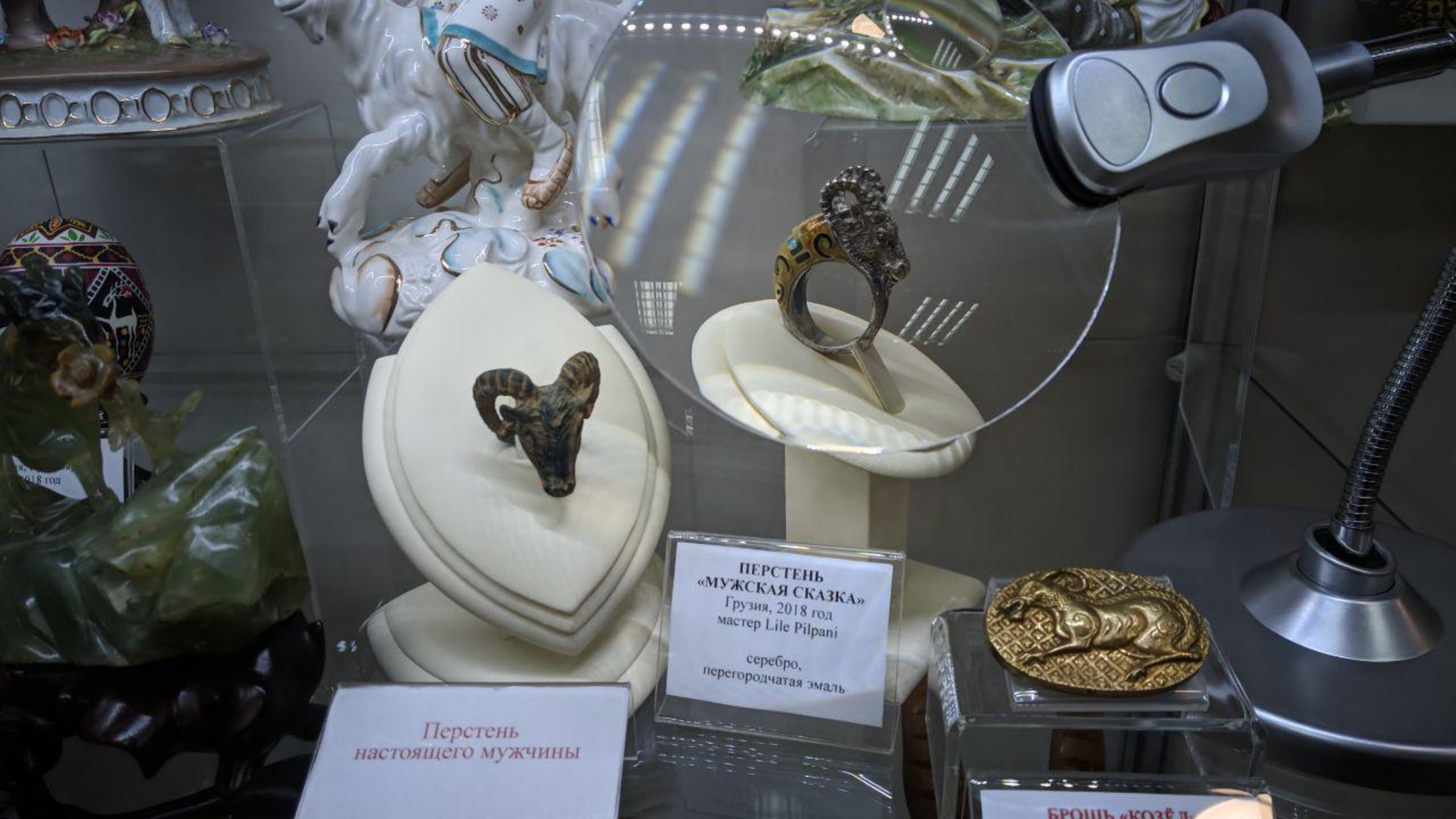
Перстень настоящего мужчины