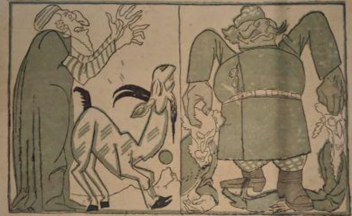
У первом эпизоде сатиры, на котором изображен акт гоним. Во втором эпизоде сатиры, изображен акт гоним.

№ 36 МЕТАМОРФОЗА ЗНАМЕНИТАГО КОЗЛА ОТПУШЕНА. ОКТЯБРЬ, 1917 Рис. А. Рубин