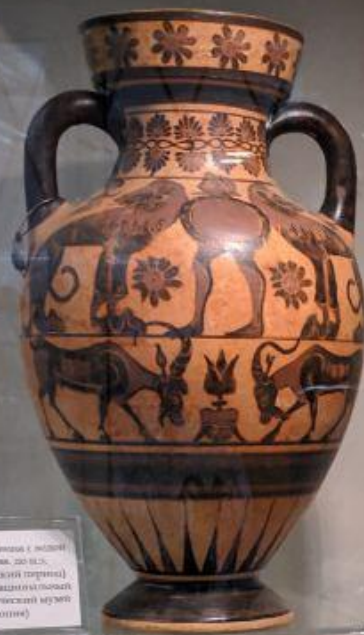
Сосуд для вина с орнаментом VII-VI вв. до н.э. (архаический период) Афины, Национальный архαιολογικος μουσειον (Колонна)