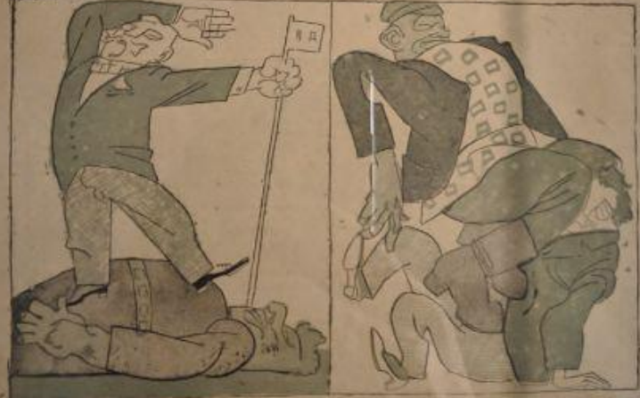
В первом эпизоде сатиры, на котором изображен акт гоним. Во втором эпизоде сатиры, изображен акт гоним.