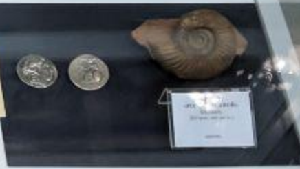
Сребърни монети и фосилна раковина