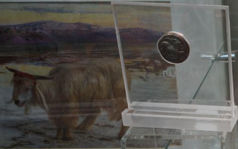
Серебряный статер 525-520/15 год до н.э. Афины, Музей нумизматики (копия)