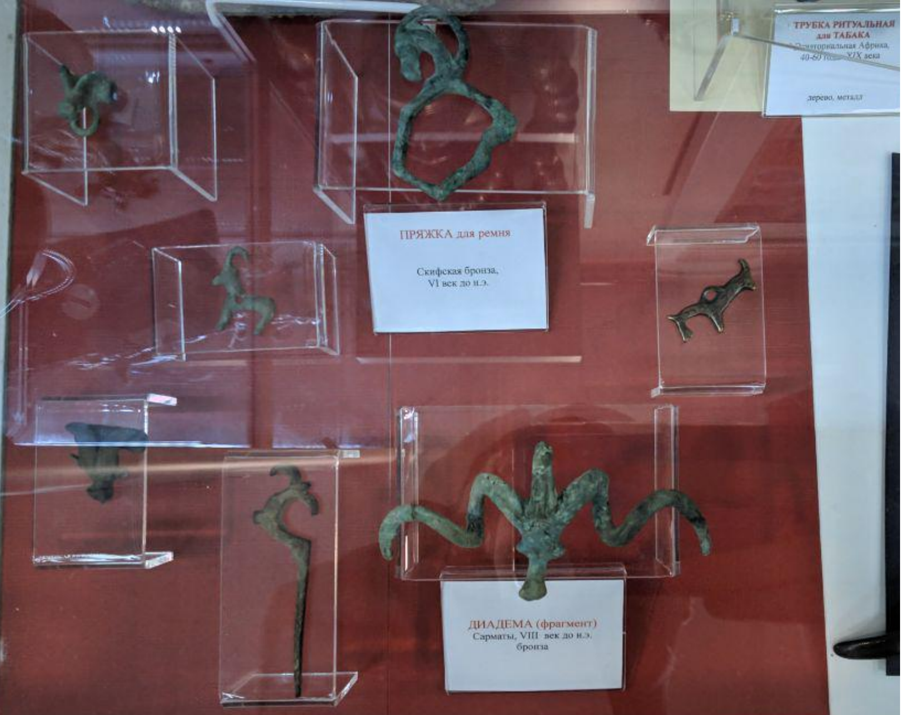
ДИАДЕМА (фрагмент) Сарматы, VIII век до н.э. бронза