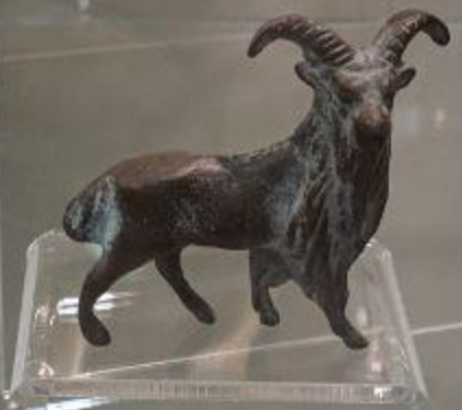
КОЗЁЛ Поздний Рим или ранняя Византия Конец IV- начало V века н.э., бронза