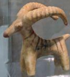
Конец XIV-XIII вв. до н.э. (поздноразвитый период) Афины, Cycladic Art Museum (Колонна)