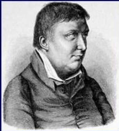
Фридрих Шлегель 1772-1829 Немецкий философ

Как философская проблема герменевтика была поставлена и разработана немецкими философами Ф.Шлегелем и Ф.Шлейермахером