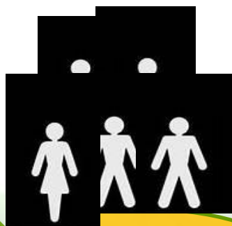
Схема работы кооператива