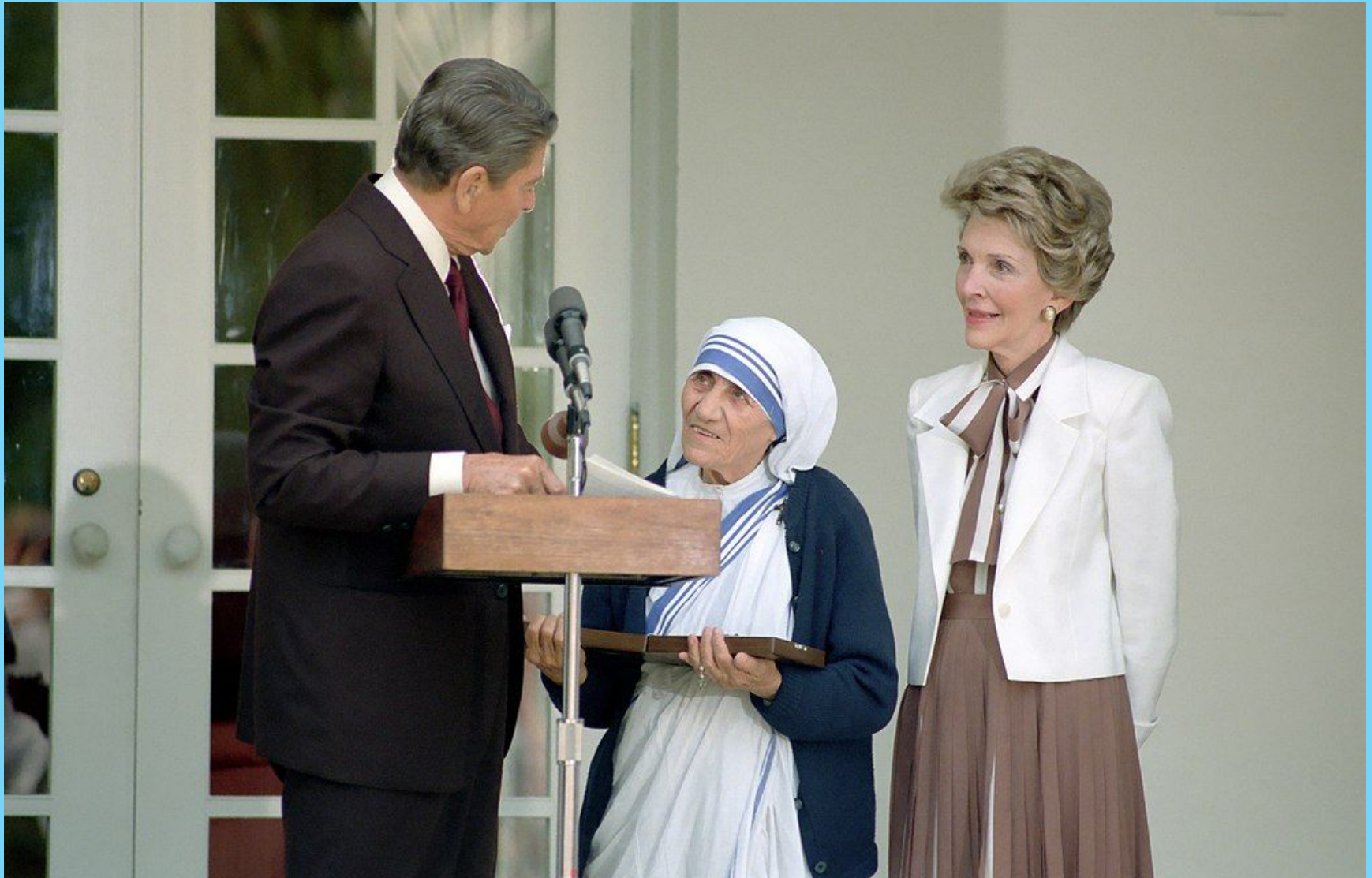
Президент Рейган вручает матери Терезе медаль Свободы. Церемония в Белом доме.