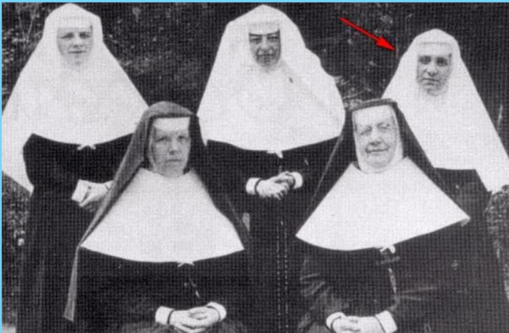
Мать Тереза с монахинями