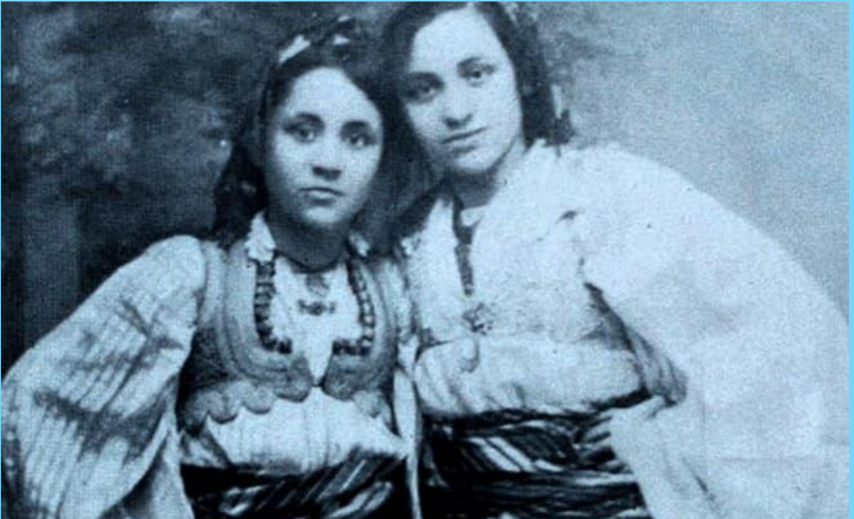
Мать Тереза с сестрой в албанском костюме