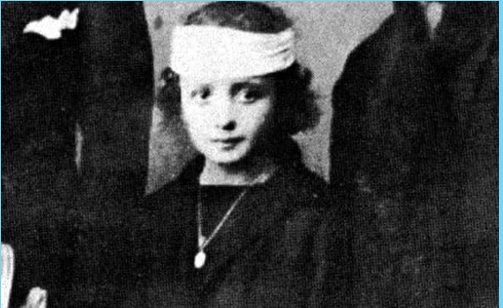
Мать Тереза в детстве