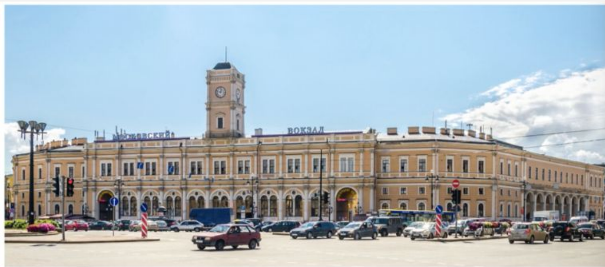
К. Тон. Московский вокзал в Санкт-Петербурге. 1844-1851