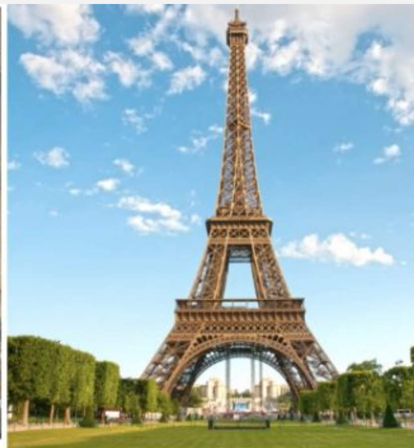
Эйфелева Башня, 1889