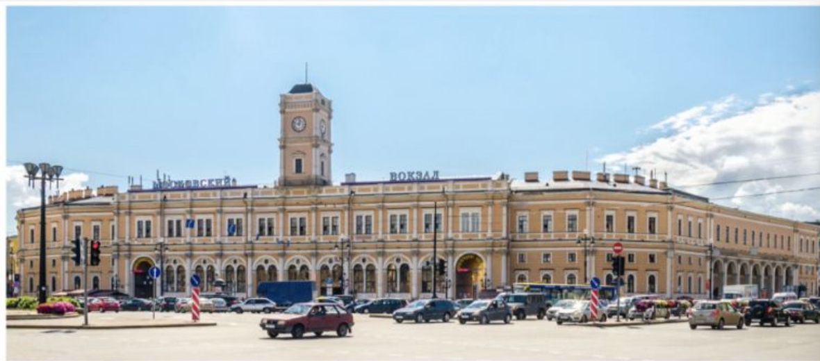
К. Тон. Московский вокзал в Санкт-Петербурге. 1844-1851