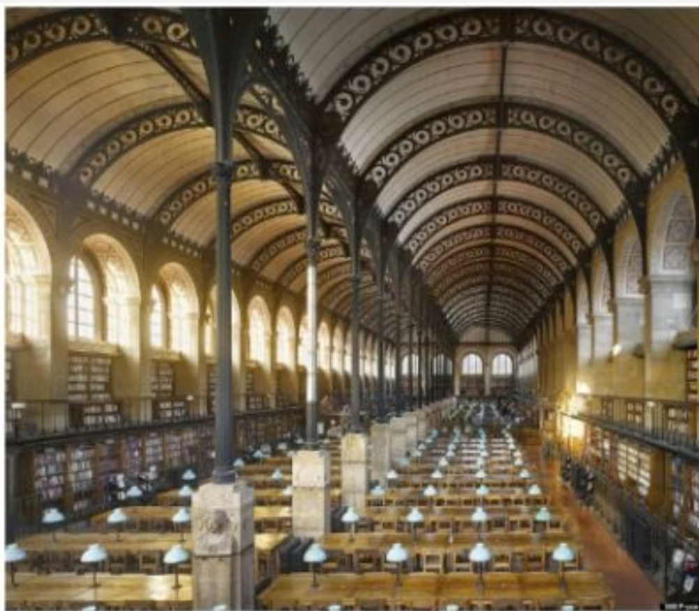
Лабруст, Библиотека Святой Женевьевы, 1843-1850