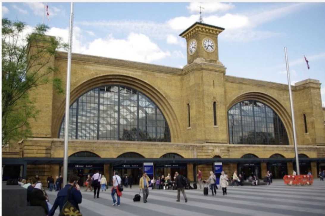
Кьюбитт. Вокзал Кингс-Кросс в Лондоне. 1851-1852