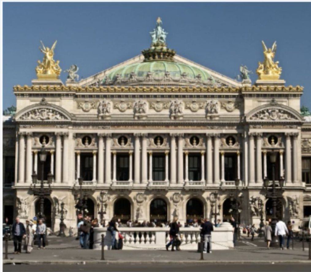
Гарнье, Опера 1862-1875