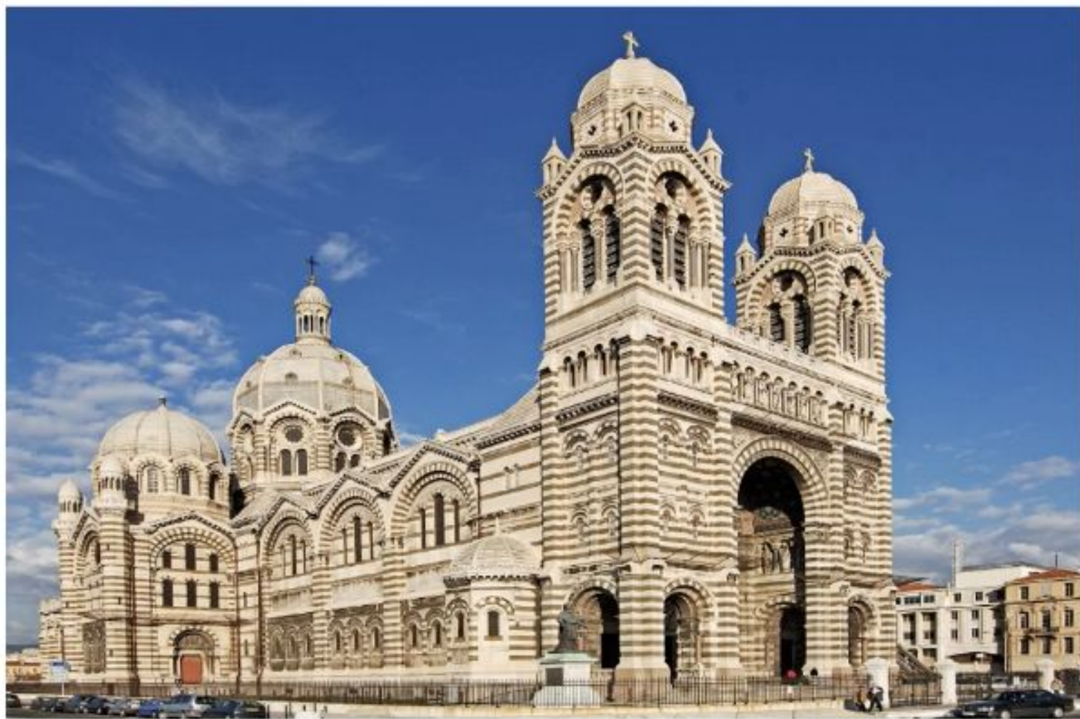
Леон Водуайе, Марсельский собор 1845-1893