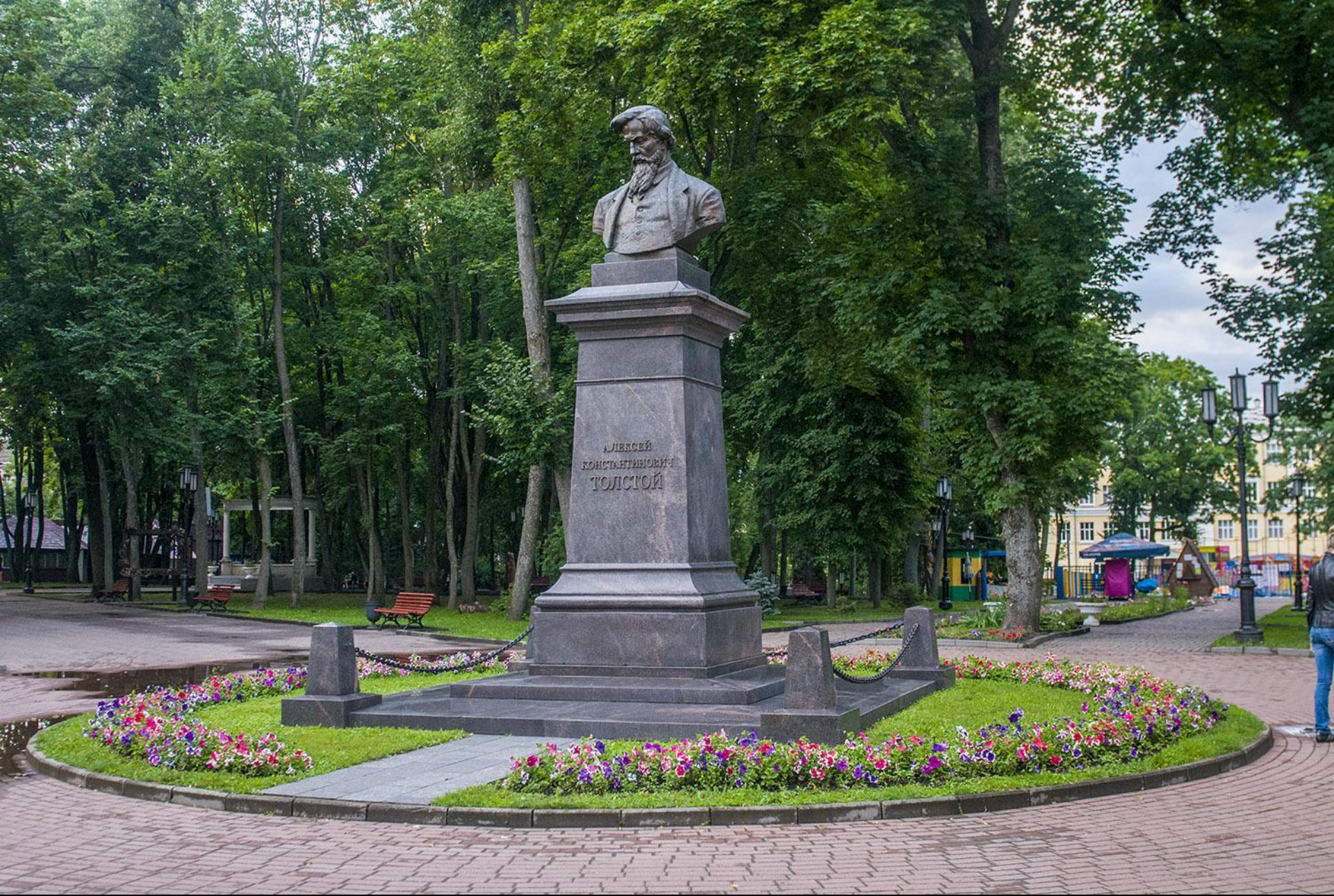
Парк Алексея Толстого