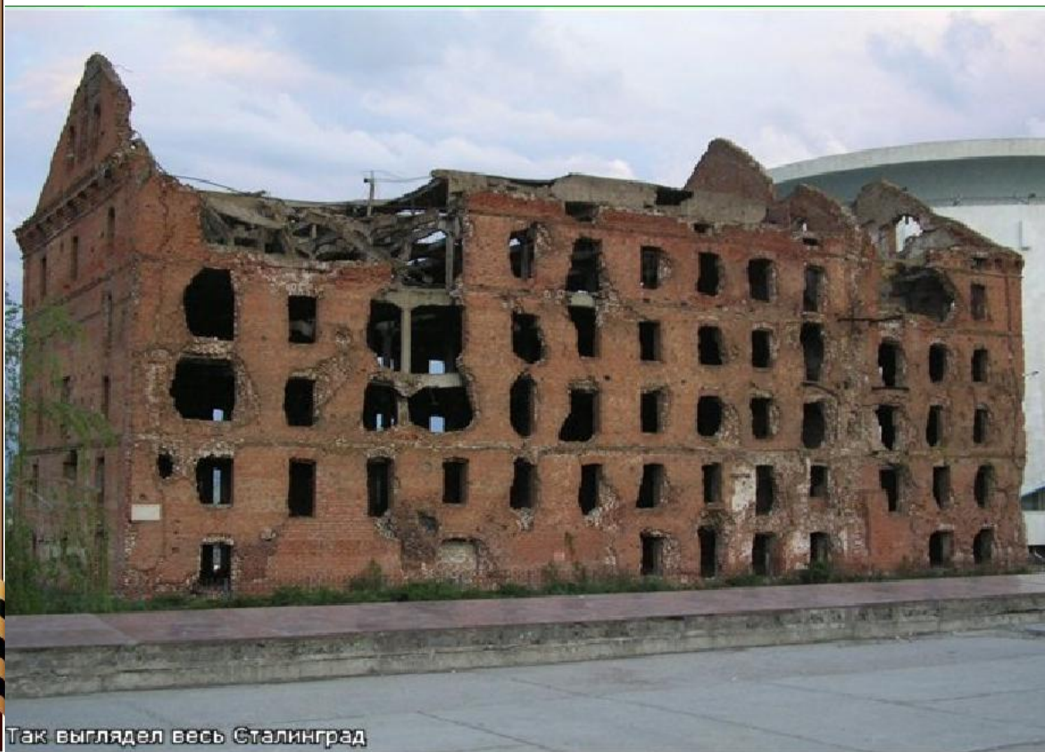
Так выглядел весь Сталинград

ДО СИХ ПОР В МЕМОРИАЛЬНОМ КОМПЛЕКСЕ СТОИТ ЭТОТ ДОМ, ИМЕНУЕМЫЙ «ДОМ ПАВЛОВА». СИМВОЛ МУЖЕСТВА, ГЕРОИЗМА И СТОЙКОСТИ. 58 ДНЕЙ И НОЧЕЙ ДЕРЖАЛИ ОБОРОНУ 24 СОВЕТСКИХ СОЛДАТА