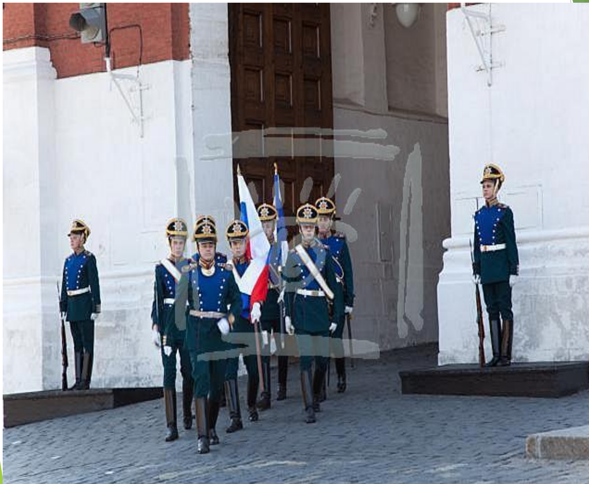
WWW.FOTOBANK.COM FB13-3336 Fotobank Москва, 2009. Смена караула на Красной площади.